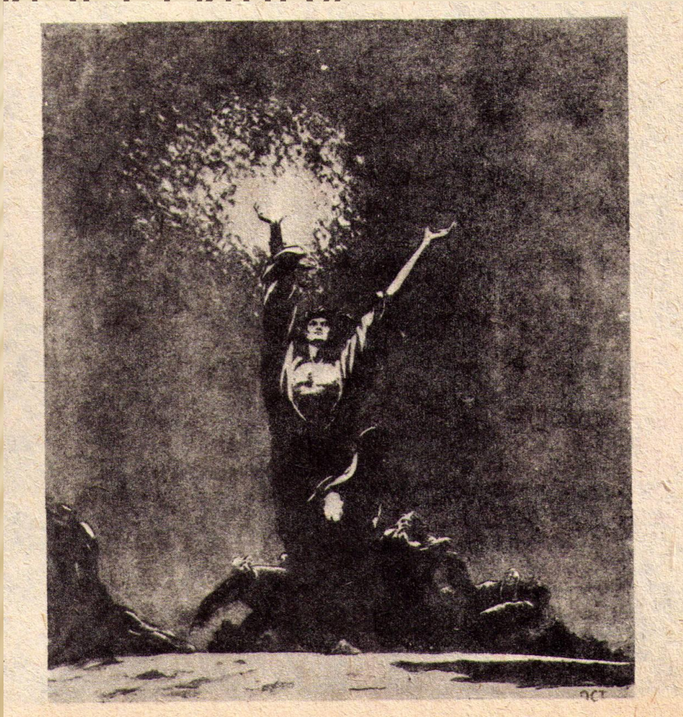
ИЛЛЮСТРАЦИЯ ХУДОЖНИКА А. ОЯ К РАССКАЗУ А.М.ГОРЬКОГО «СТАРУХА ИЗ БЕРГИПЬ»

«И вдруг он разорвал руками себе грудь и вырвал из неё своё сердце и высоко поднял его над головой»