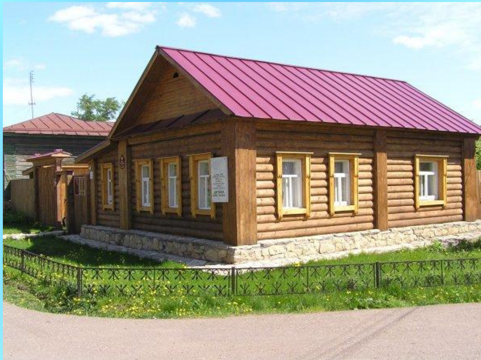
Дом - музей