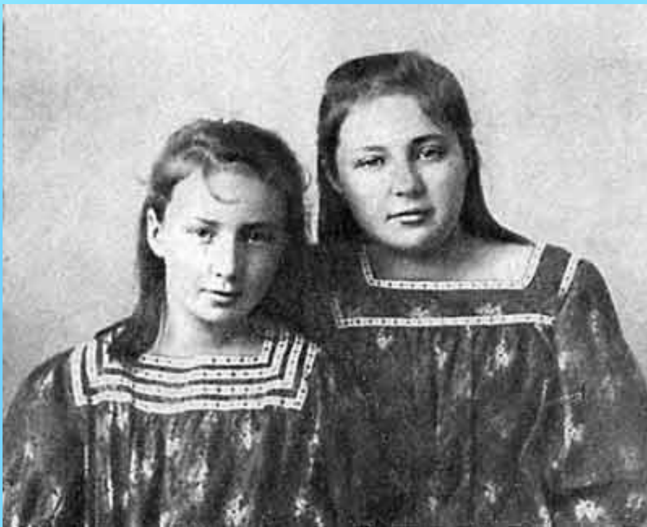
Марина и Анастасия Цветаевы