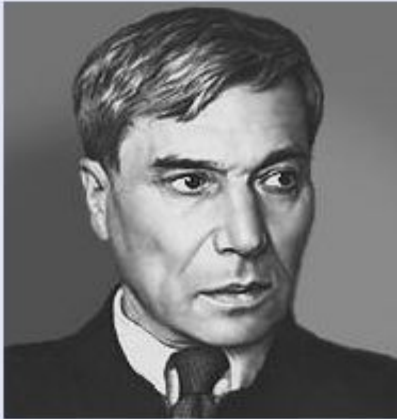
Б. Л. Пастернак.