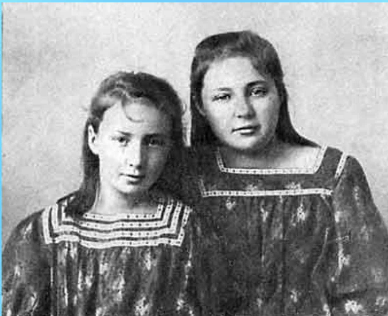
Марина и Анастасия Цветаевы