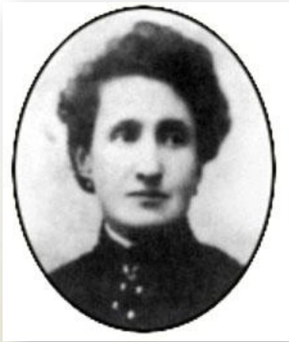
Мария Александровна Цветаева, урождённая Мейн, мать