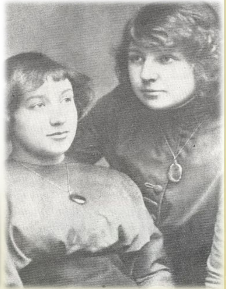
Сёстры Цветаевы, Анастасия и Марина