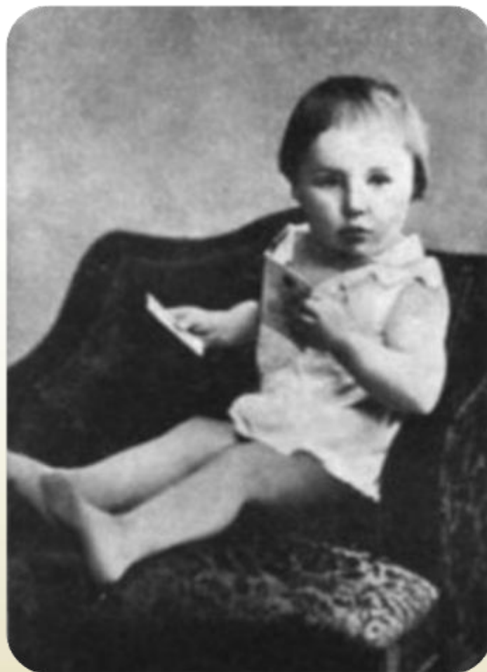
Марина Цветаева в детстве.