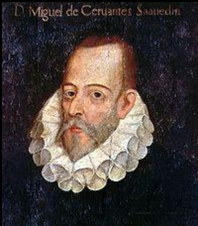
Miguel de Cervantes Saavedra