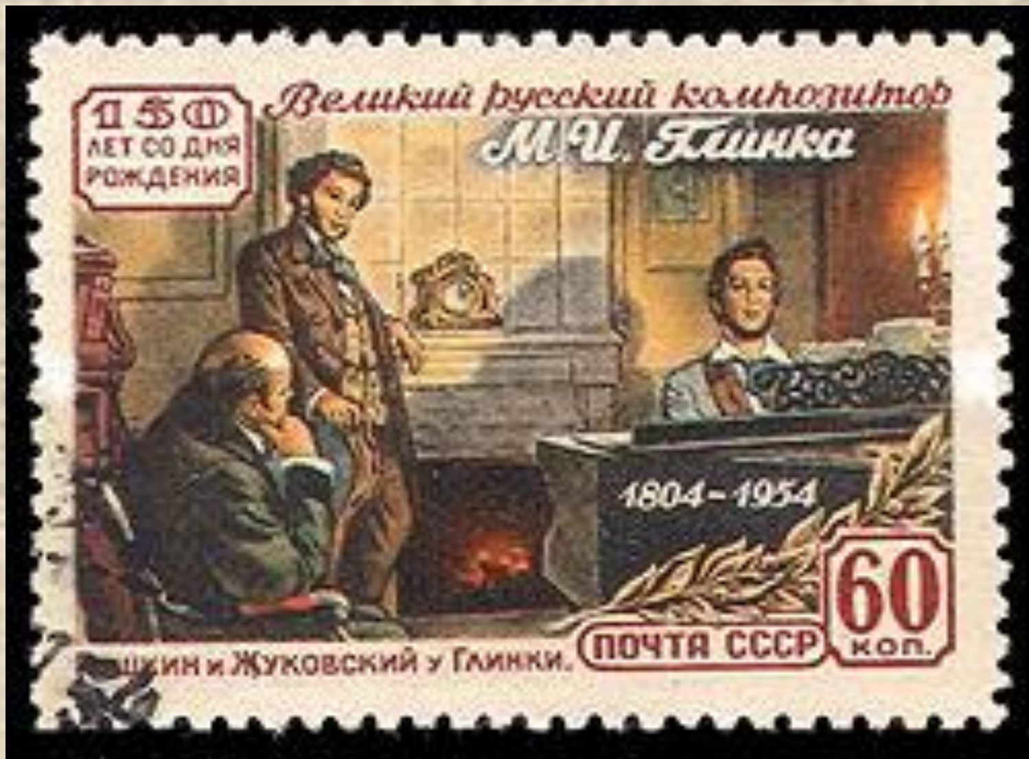
В.А.Жуковский, А.С.Пушкин, М.И.глинка