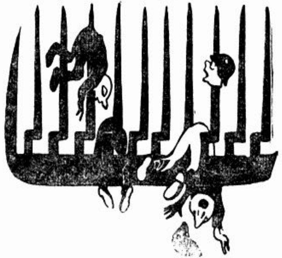
Рис. Б. Пророкова. Стихи М. Дудина. «Красный Гангут», 4 ноября 1941 г.

Стихи ивановца - поэта М.Дудина, рисунок ивановца -художника Б. Пророкова из газеты «Красный Гангут