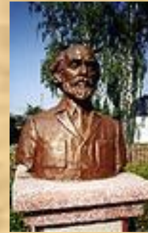
Памятник М.М. Пришвину (2001г., с.Становое)