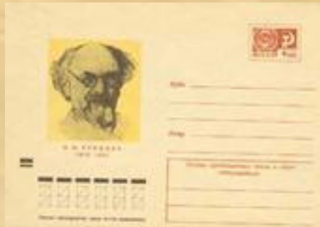
Почтовая открытка с изображением М.М. Пришвина