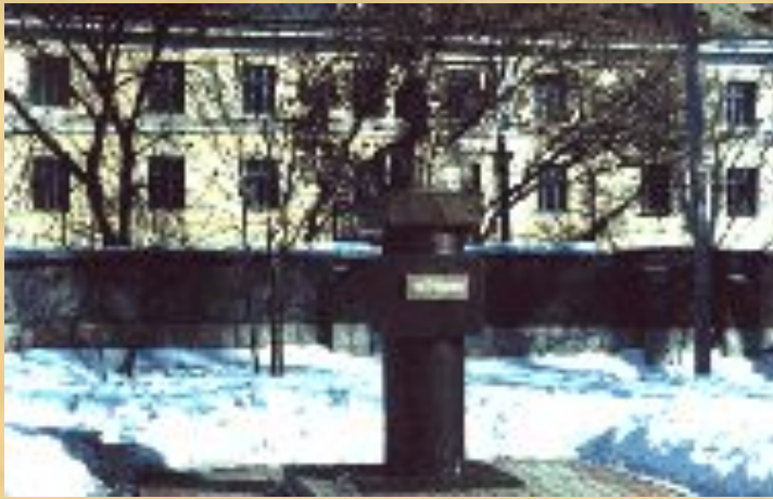
Памятник М. М. Пришвину в Ельце