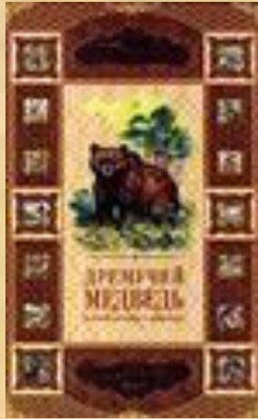
Дремучий медведь и другие истории о животных.