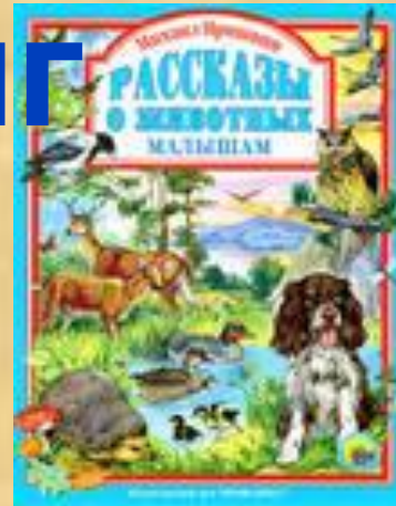
Рассказы о животных