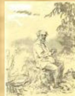
М.М. Пришвин (рисунок И. Бруни)