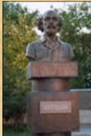
Бюст М.М.Пришвина в Ельце