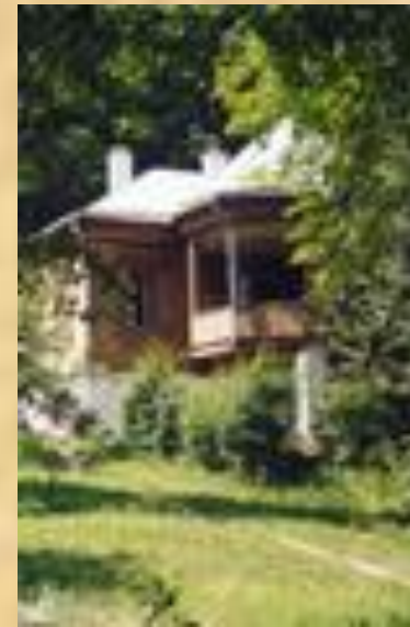
Музей М.М. Пришвина