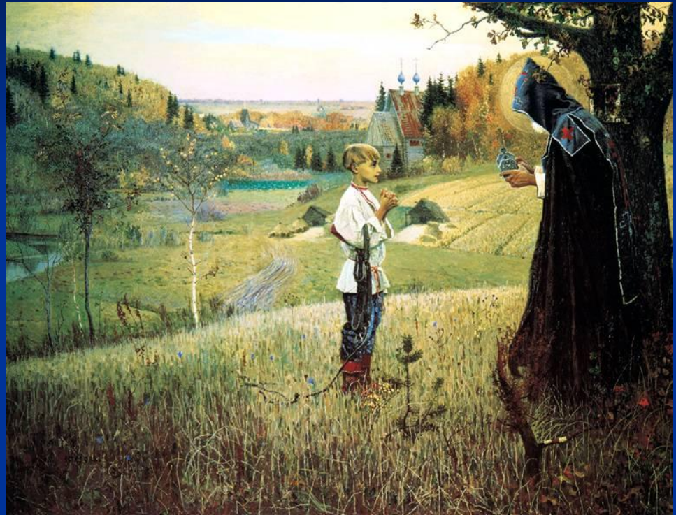
Видение отроку Варфоломею