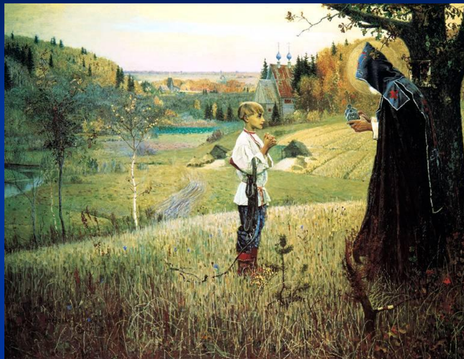
Видение отроку Варфоломею