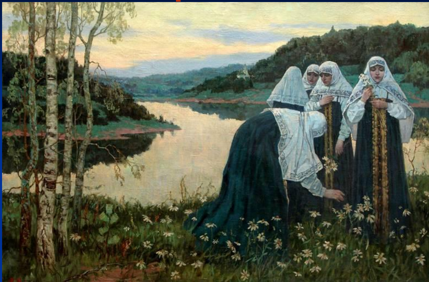
Девушки на берегу