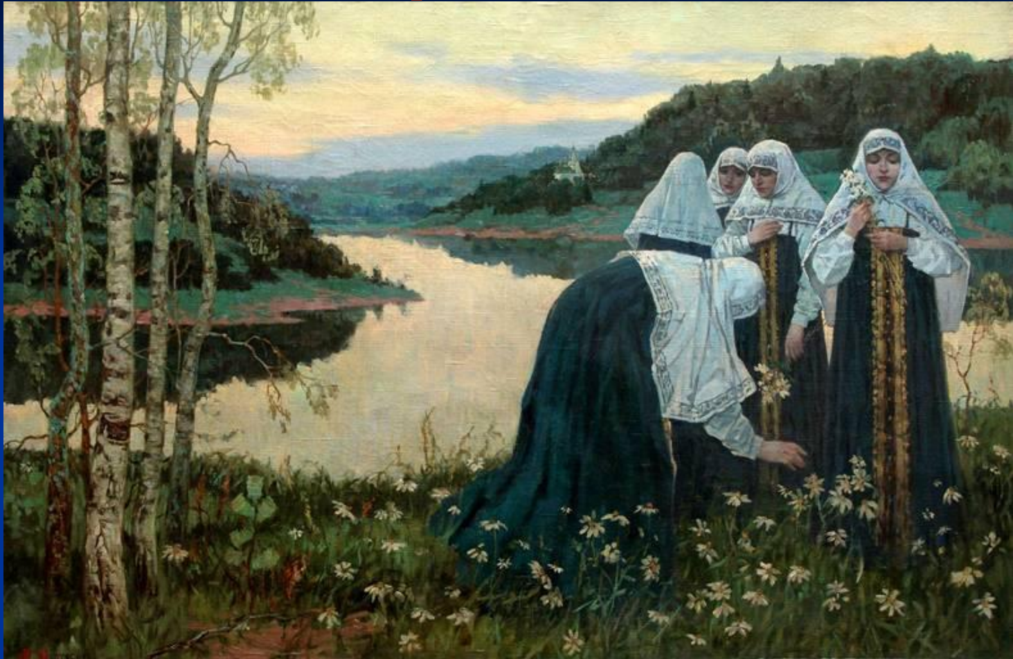
Девушки на берегу