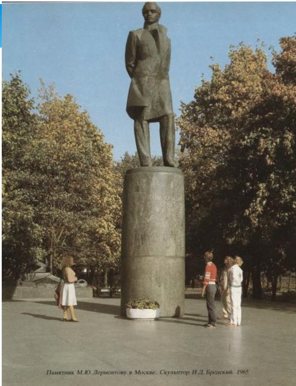
Памятник М.Ю. Лермонтову в Москве. Скульптор И.Д. Бродский. 1965

Памятник М. Ю. Лермонтову в Москве. Скульптор И. Д. Бродский. 1965