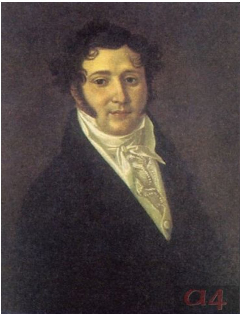
Юрий Петрович Лермонтов, отец поэта. Неизвестный художник. 1810-е

По мужской линии род Лермонтовых (отец поэта — Юрий Петрович Лермонтов, капитан в отставке из небогатых помещиков Тульской губ.) ведет свое начало от Георга Лермонта (Шотландия). Находясь на службе у польского короля, в 1613 г. Лермонт перешел на сторону русских, сражался в чине офицера в отряде Д. Пожарского и в 1621 г. за хорошую службу царю получил грамоту на владение землей в Галическом у. Костромской губ. От него и пошли Лермонтовы, уже во втором поколении принявшие