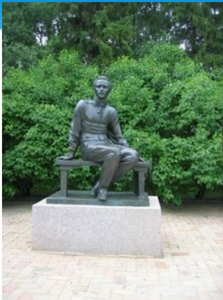
Памятник М. Ю. Лермонтову в Тарханах