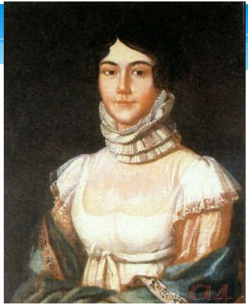
Мария Михайловна Лермонтова, мать поэта. Неизвестный художник. 1810-е

По материнской линии М. Лермонтов происходил из известного в России и богатого дворянского рода