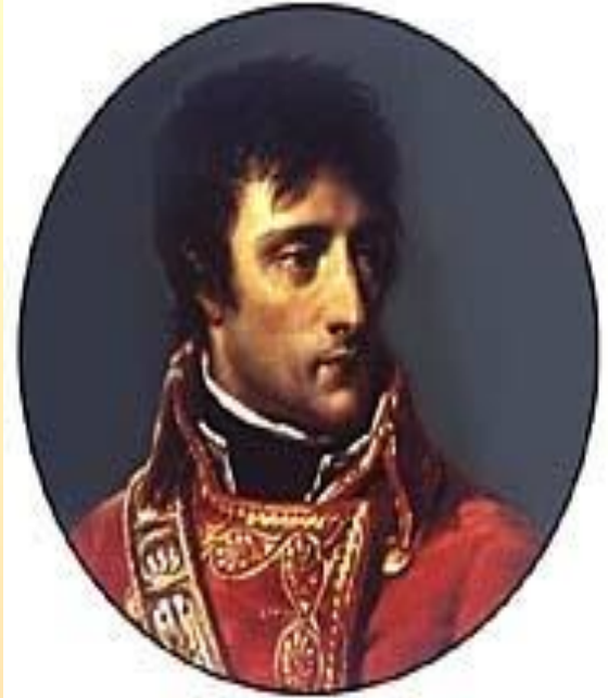
Наполеон Бонапарт – французский государственный деятель, полководец.