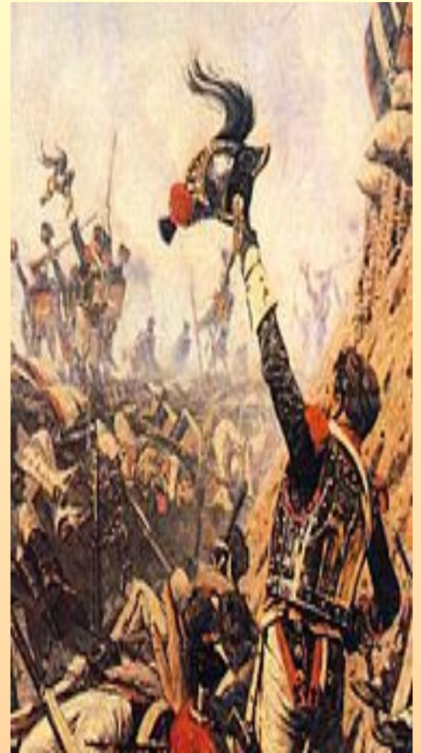
В.В.Верещагин. «Конец Бородинского сражения».