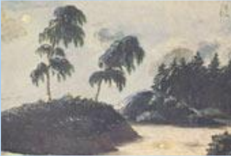
Пейзаж с двумя березами.