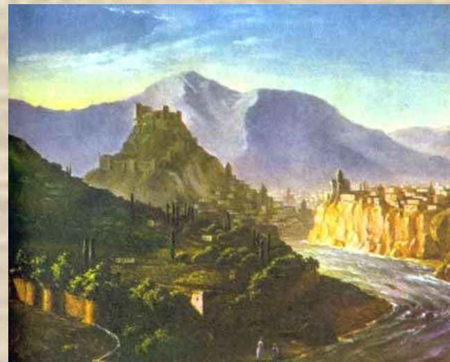
М. Ю. Лермонтов «Вид Тифлиса».