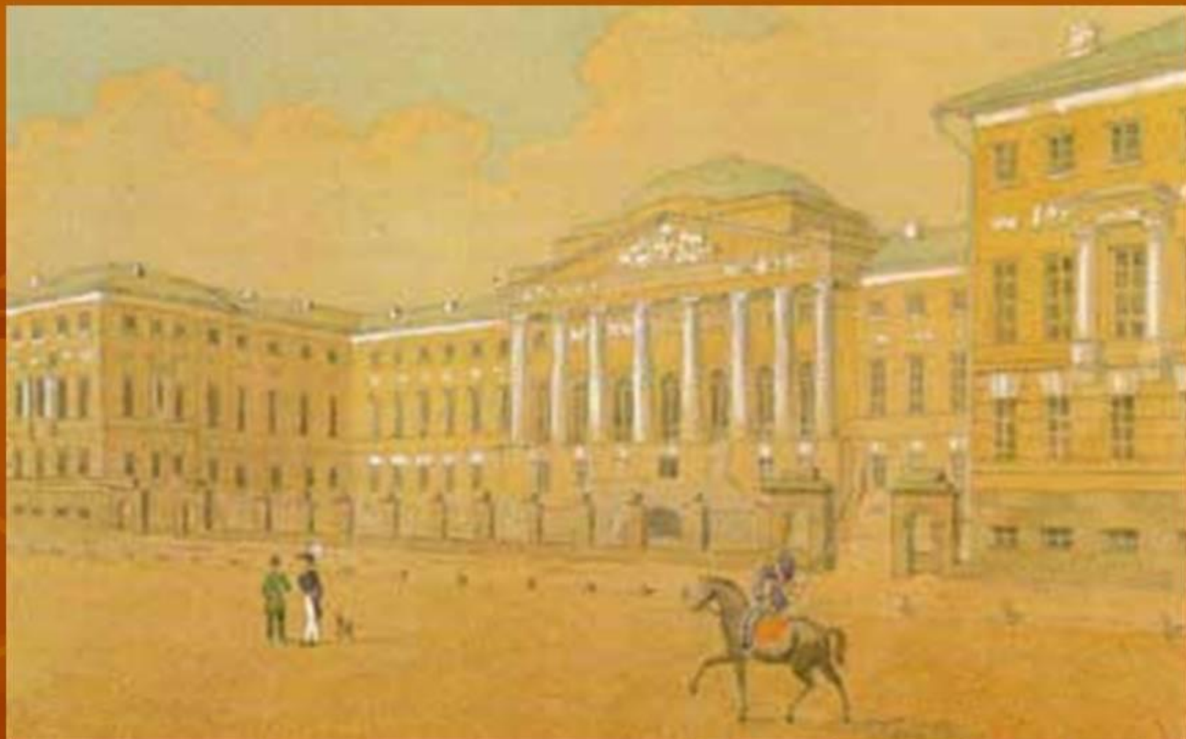
Москва. Благородный пансион при Московском университете.