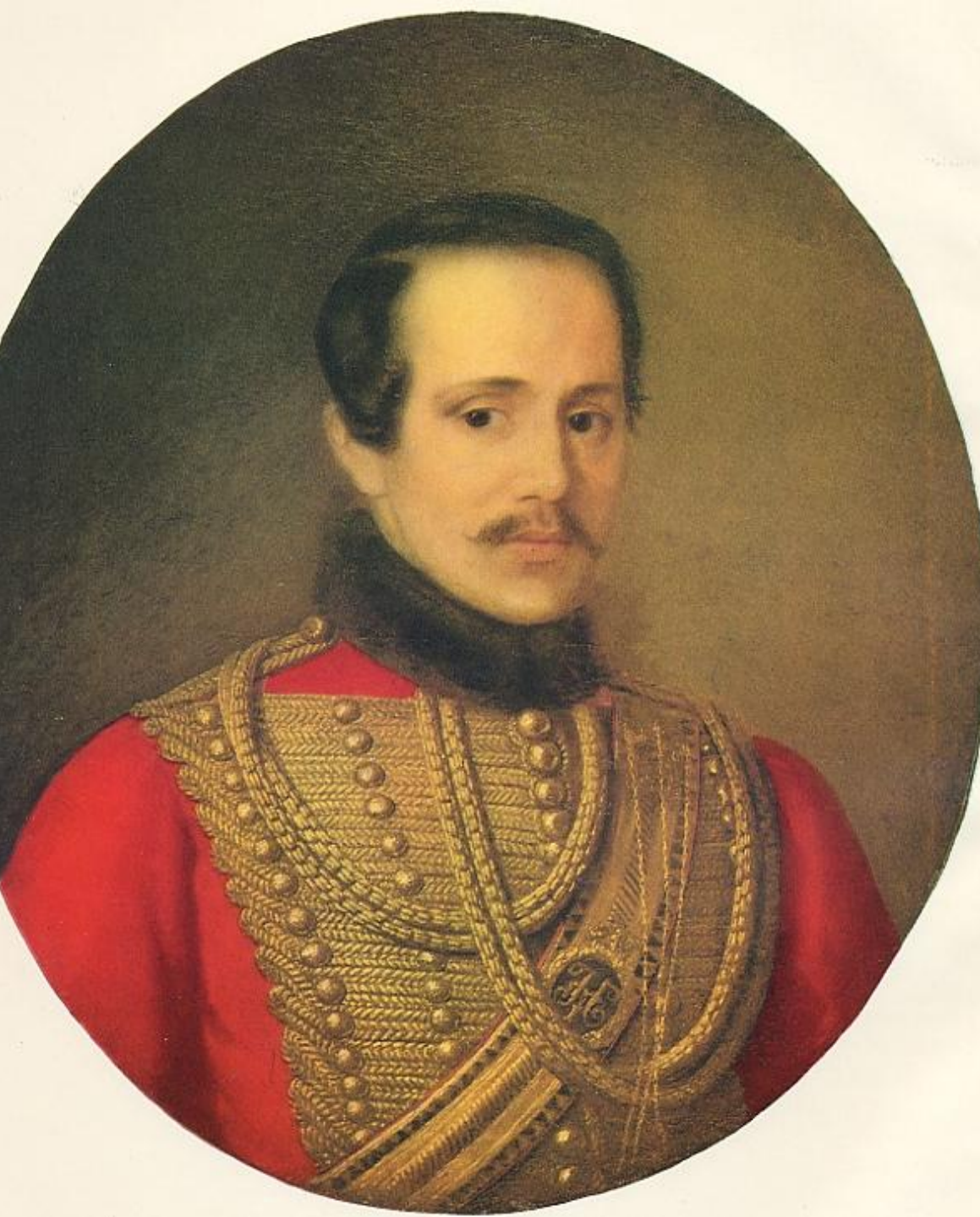
Михаил Юрьевич Лермонтов