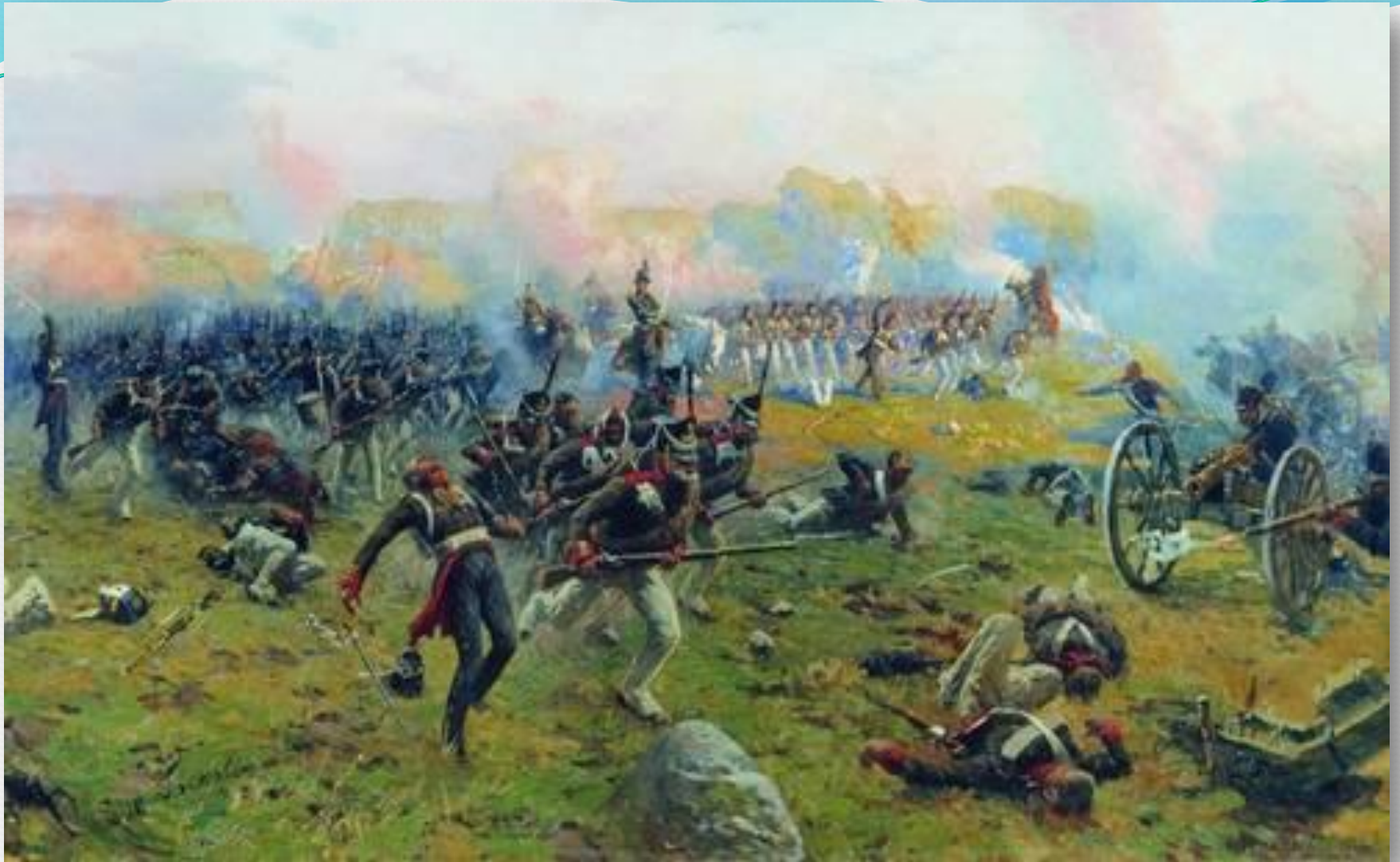
М.Греков. Лейб-гвардии гренадёрский полк в сражении при Бородино.