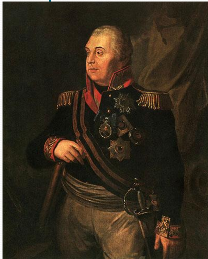
Р.Болков. Фельдмаршал М.И.Кутузов.

После сражения под Бородино по решению Михаил Илларионовича Кутузова русская армия для восстановления сил отступила и оставила Москву неприятелю. Наполеон отдал город на разграбление. Но вскоре в Москве вспыхнул пожар. Французы покинули город.