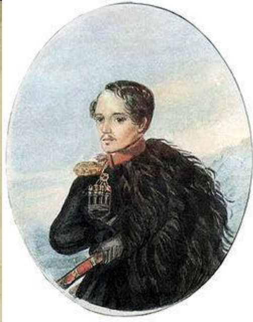
Автопортрет М.Ю. Лермонтов

Одним из этих талантов был М.Ю. Лермонтов.