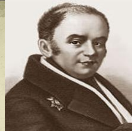
Жуковский Василий Андреевич

Последовал арест и судебное разбирательство, за которым наблюдал сам император; за Лермонтова вступились пушкинские друзья, прежде всего Жуковский, близкий императорской семье, кроме этого бабушка, имевшая светские связи, сделала все, чтобы смягчить участь единственного внука. Некоторое время спустя корнет Лермонтов был переведён прапорщиком в Нижегородский драгунский полк, действовавший на Кавказе.