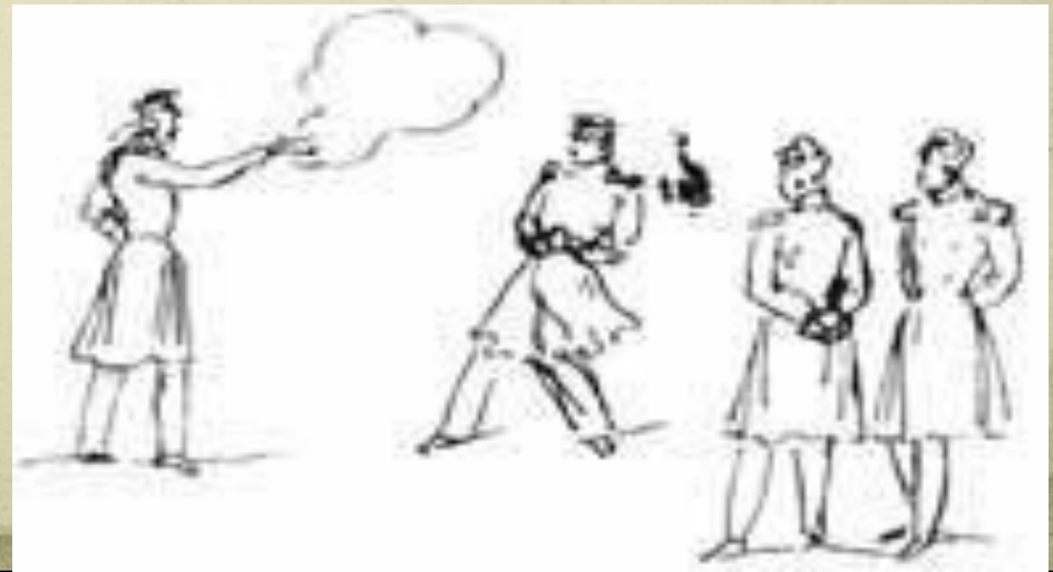
Дуэль Рисунок М.Ю. Лермонтова

В результате — дуэль, окончившаяся благополучно, но для Лермонтова повлекла арест на гауптвахте, потом перевод в Тенгинский пехотный полк на Кавказе.