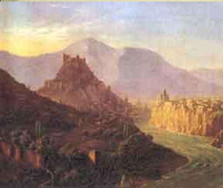
Вид Тифлиса М.Ю. Лермонтов

Синие горы Кавказа, приветствую вас! вы взлелеяли детство мое; вы носили меня на своих одичалых хребтах; облаками меня одевали, вы к небу меня приучили, и я с той поры все мечтаю о вас да о небе.