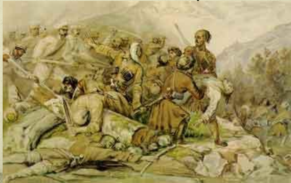
Эпизод сражения при Валерике 11 июня 1840 г. Акварель М.Ю. Лермонтова и Г.Г. Гагарина