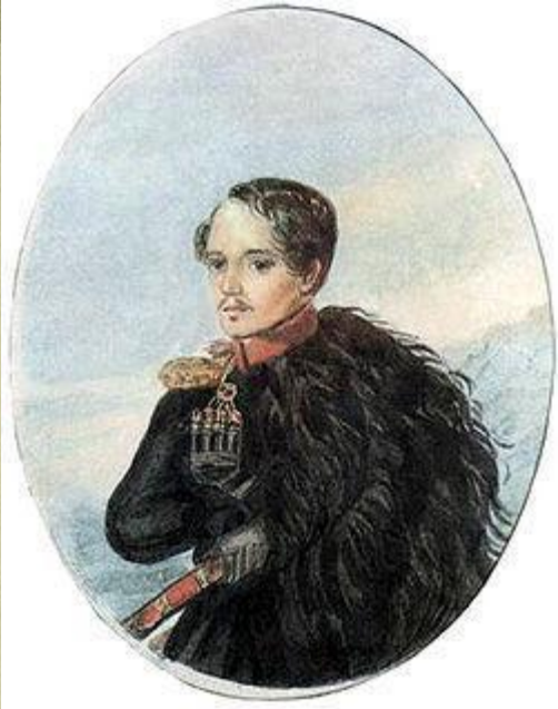
Автопортрет М.Ю. Лермонтов

Одним из этих талантов был М.Ю. Лермонтов.