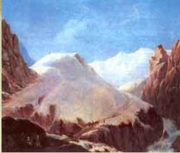
Крестовая гора М.Ю. Лермонтов