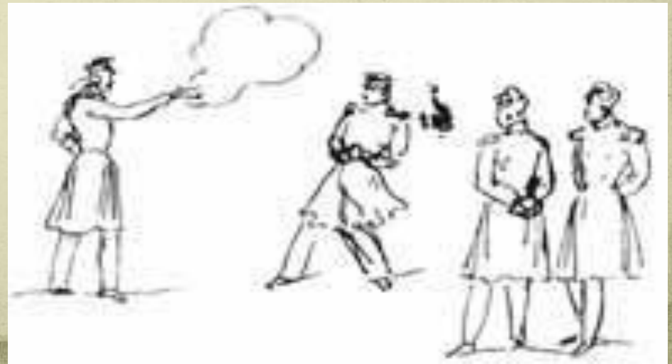
Дуэль Рисунок М.Ю. Лермонтова

В результате — дуэль, окончившаяся благополучно, но для Лермонтова повлекла арест на гауптвахте, потом перевод в Тенгинский пехотный полк на Кавказе.