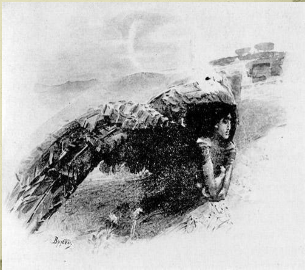
Демон Иллюстрация Врубеля