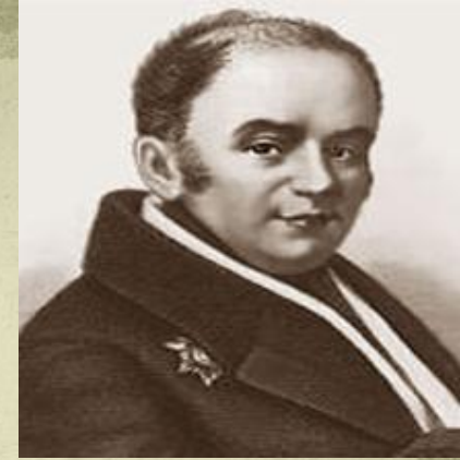
Жуковский Василий Андреевич

Последовал арест и судебное разбирательство, за которым наблюдал сам император; за Лермонтова вступились пушкинские друзья, прежде всего Жуковский, близкий императорской семье, кроме этого бабушка, имевшая светские связи, сделала все, чтобы смягчить участь единственного внука. Некоторое время спустя корнет Лермонтов был переведён прапорщиком в Нижегородский драгунский полк, действовавший на Кавказе.