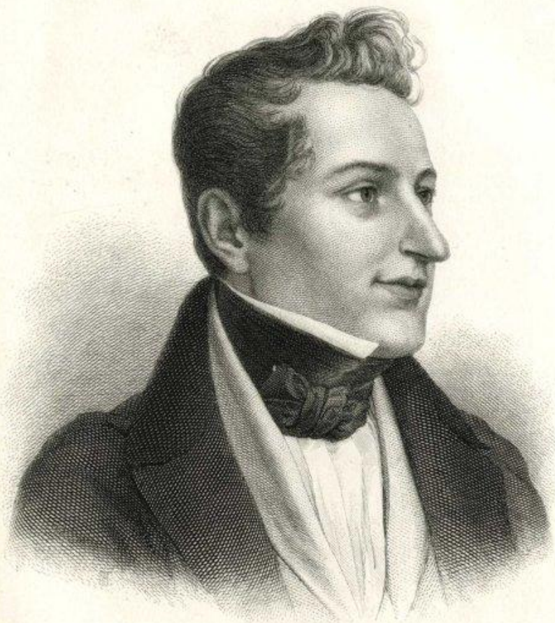
Рис. со стали Ф.А.Брокгауза въ Лейпцигѣ.