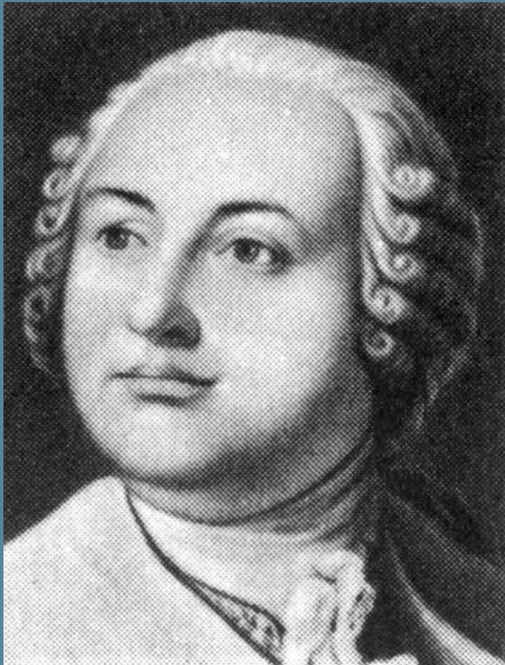
Портрет Михайло Васильевича Ломоносова