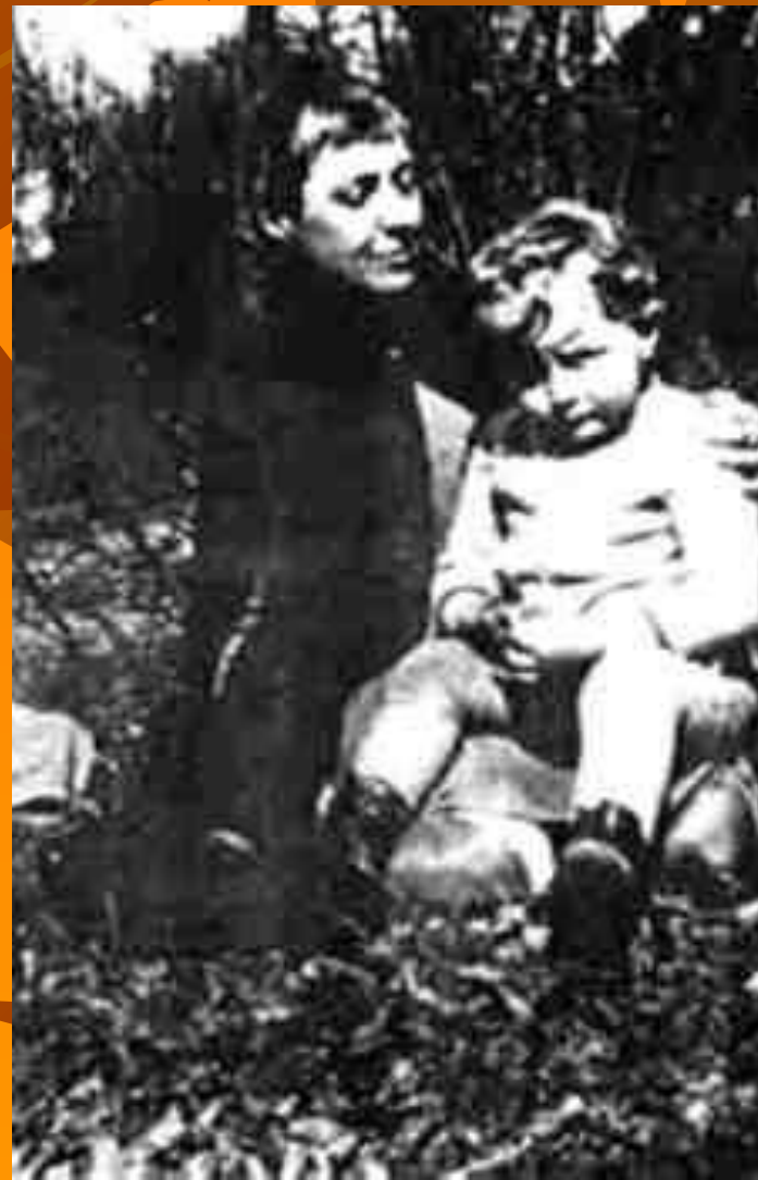
М.Цветаева с сыном