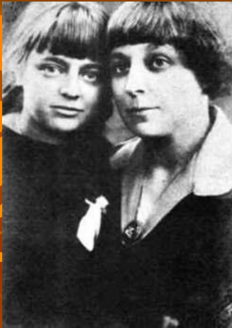
М.Цветаева с дочерью Ариадной