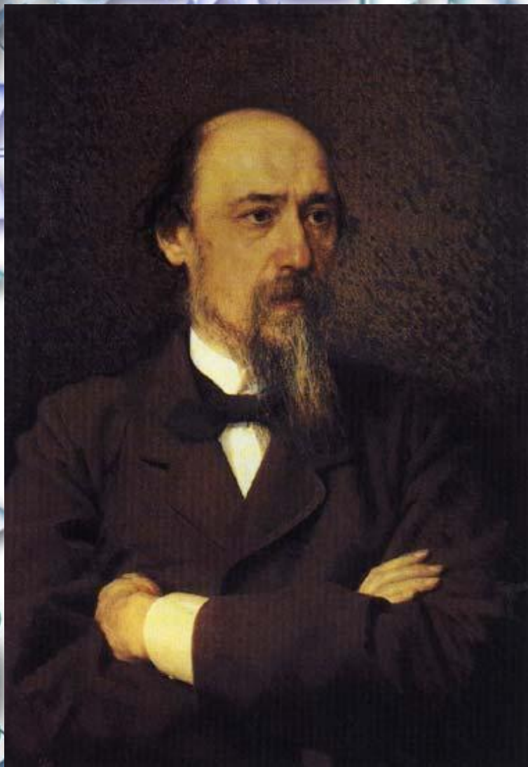
Николай Алексеевич Некрасов