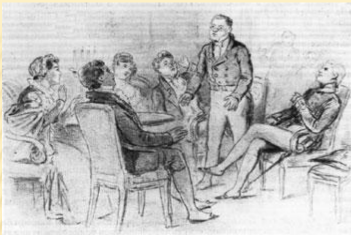
САЛОН АННЫ ПАВЛОВНЫ ШЕРЕР.

Всё не естественно, лицемерно в салоне А. П. Шерер. Всё живое, будь то мысль и чувство, искренний порыв или злободневная острота, гаснет в бездушной обстановке. Контрастирует с описанием петербургского салона картина именин в доме Ростовых в Москве.