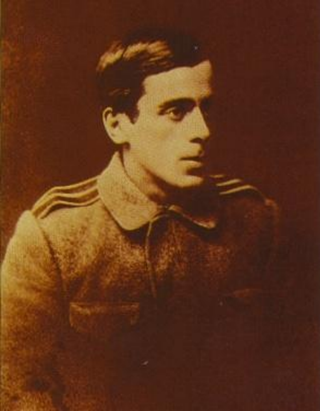
Сергей Эфрон. 1917