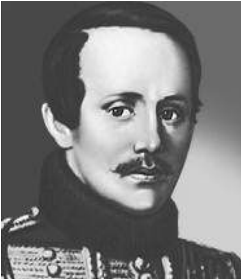
Лермонтов Михаил Юрьевич (1814-1841)