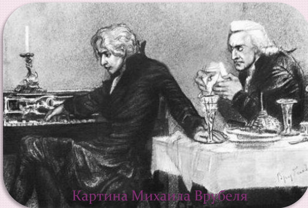
Картина Михаила Врубеля

Драма жизни и творчества Моцарта, а также загадка его смерти стали плодотворной темой для художников всех видов искусств. Моцарт стал героем многочисленных произведений литературы, драматургии и кинематографа. Все их перечислить невозможно — ниже приведены наиболее известные из них: «Маленькие трагедии. Моцарт и Сальери.» А. С. Пушкин, драма «Моцарт на пути в Прагу». — Эдуард Мёрике, повесть «Амадей». — Питер Шеффер, пьеса. Высоко оцененную книгу о композиторе написал Г. В. Чичерин и другие