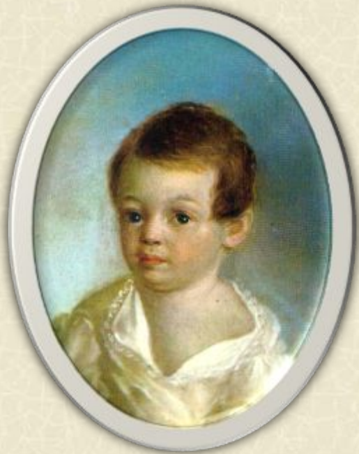
Ксавье де Местр. Пушкин-ребенок. 1800-1802. Металлическая пластинка, масло.