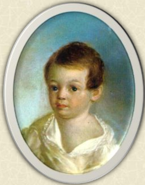
Ксавье де Местр. Пушкин-ребенок. 1800-1802. Металлическая пластинка, масло.