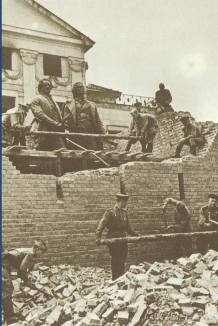
Советские бойцы разбирают укрытие, в котором находились памятники Гёте и Шиллеру. Германия, Веймар. 1944 г.

Бойцы притихли. Звучит музыка Чайковского. Германия. 1945 год.