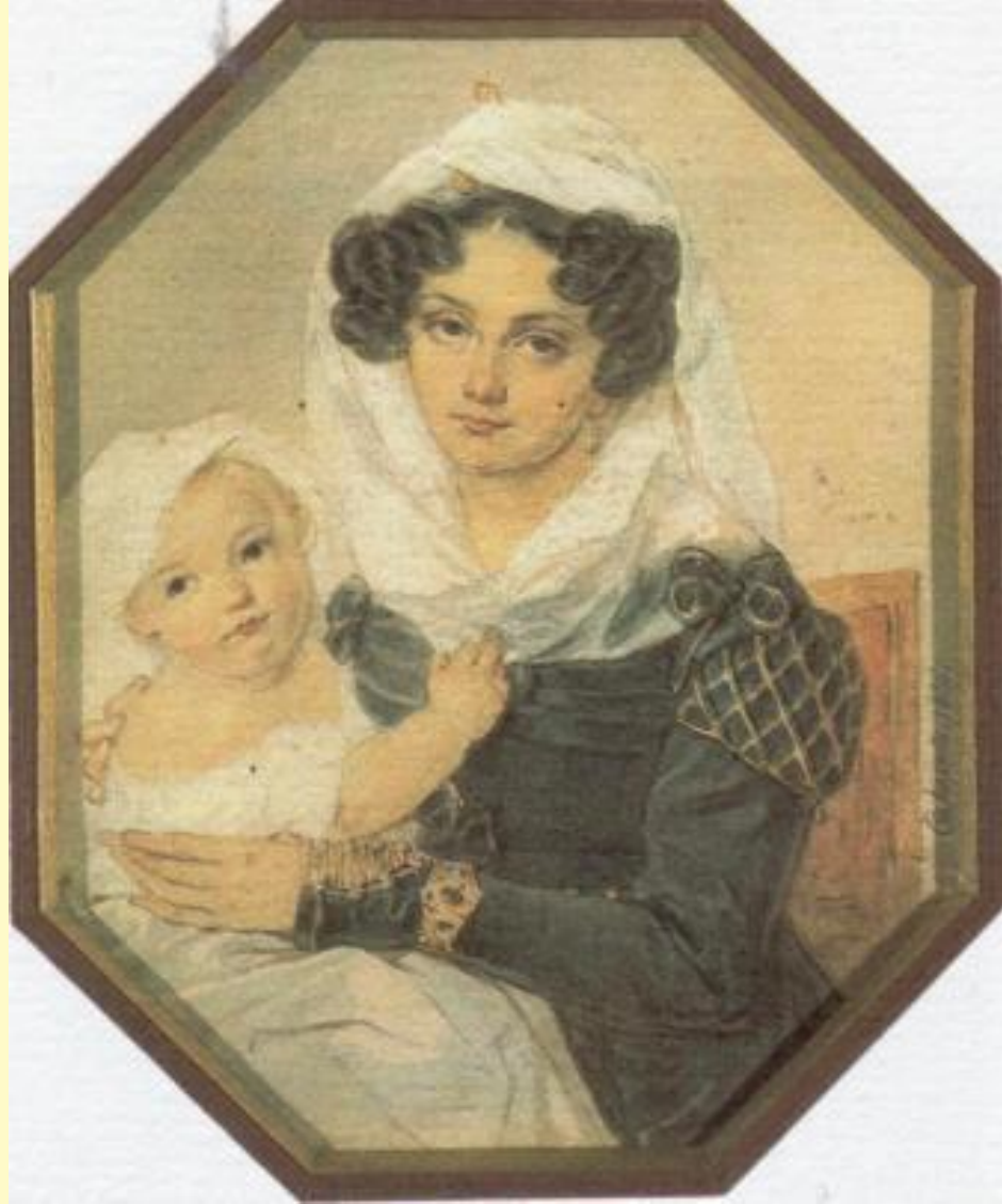
Соколов М.Н. М.Н.Волконская с сыном. 1826