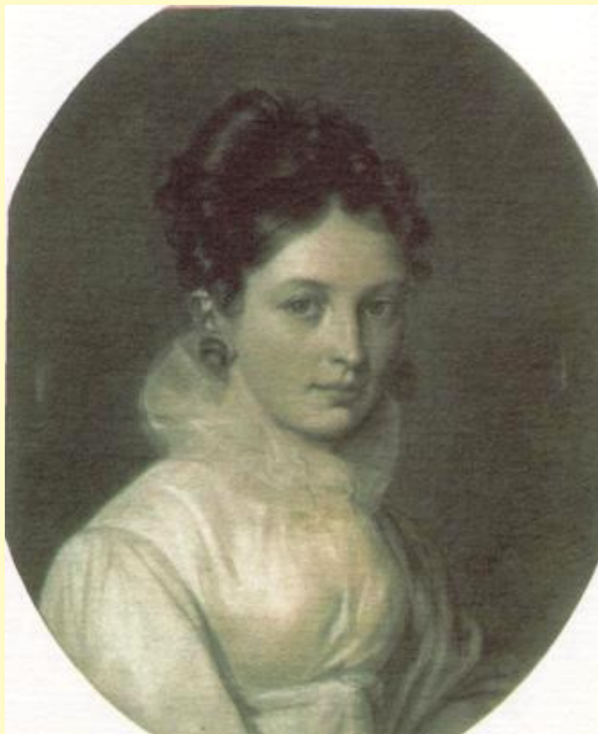
Бакунина Е.П. Автопортрет. 1816