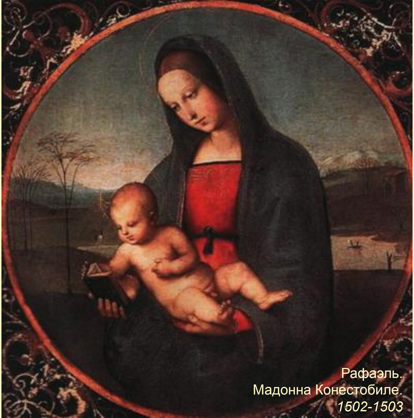
Рафаэль. Мадонна Конестобиле. 1502-1503