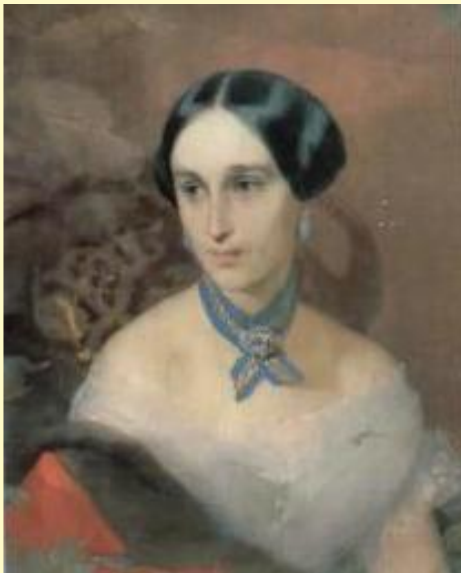
И.К.Макаров. 1849. Наталья Николаевна Ланская