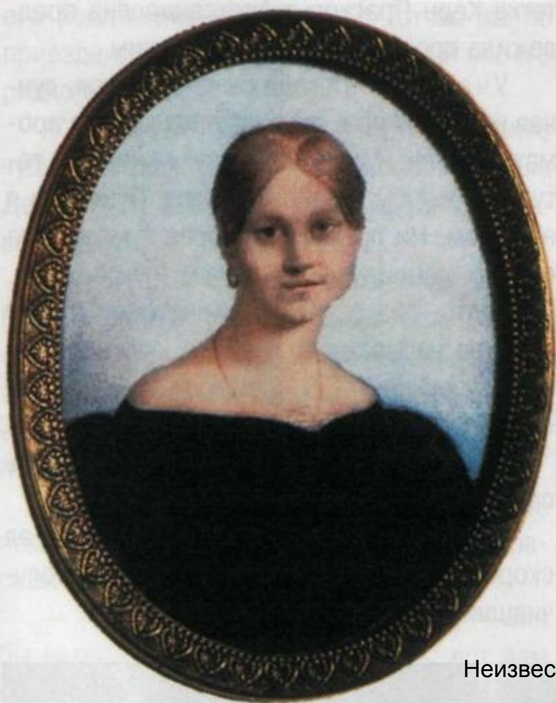
А. П. Керн. Неизвестный художник. 1820-е годы