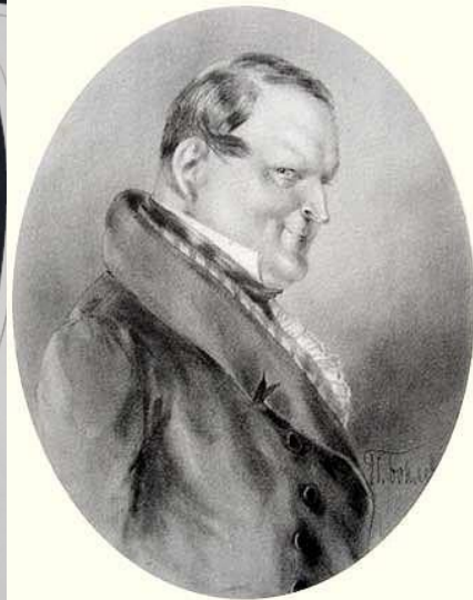
Павел Иванович Чичиков