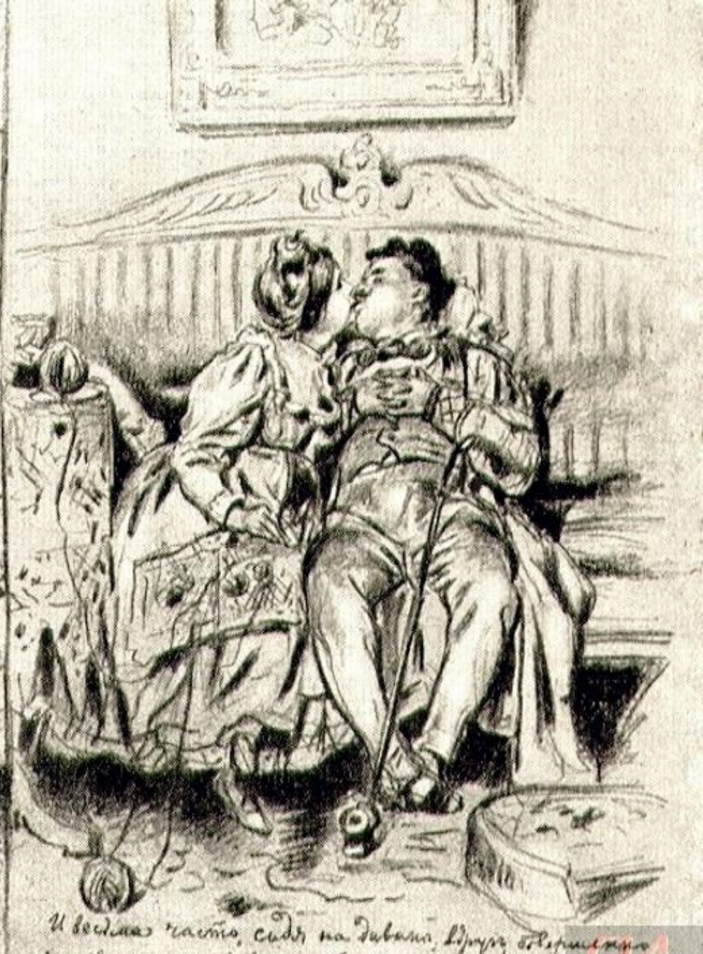
Розум, душенька, свої ромики, а інші словами Кучерка