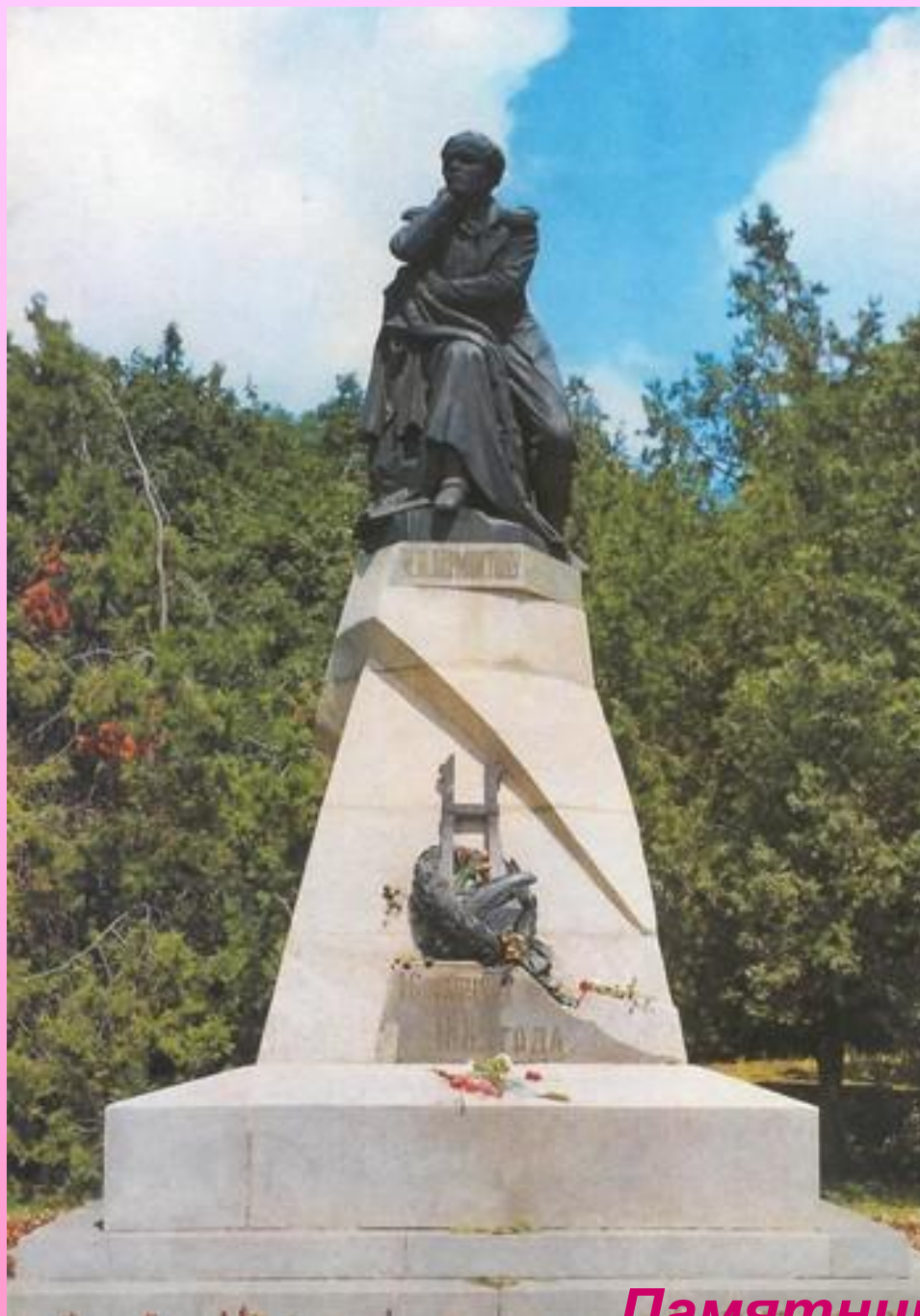
Памятник в Пятигорске