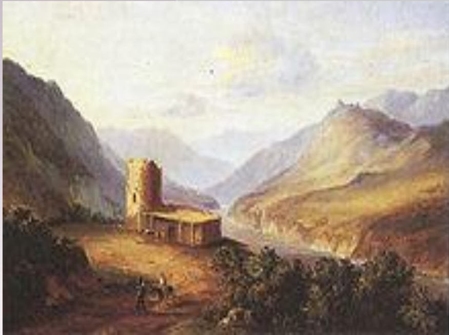
РИСОВАЛ М.Ю. ЛЕРМОНТОВ