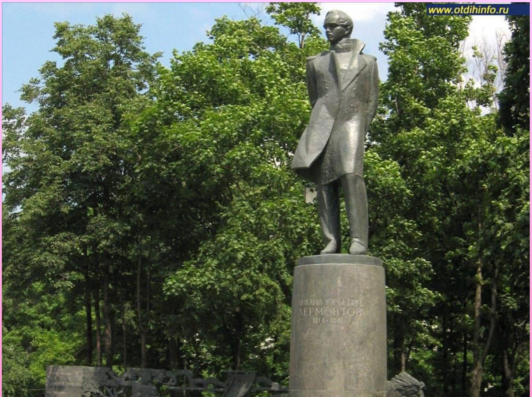
Памятник в Москве