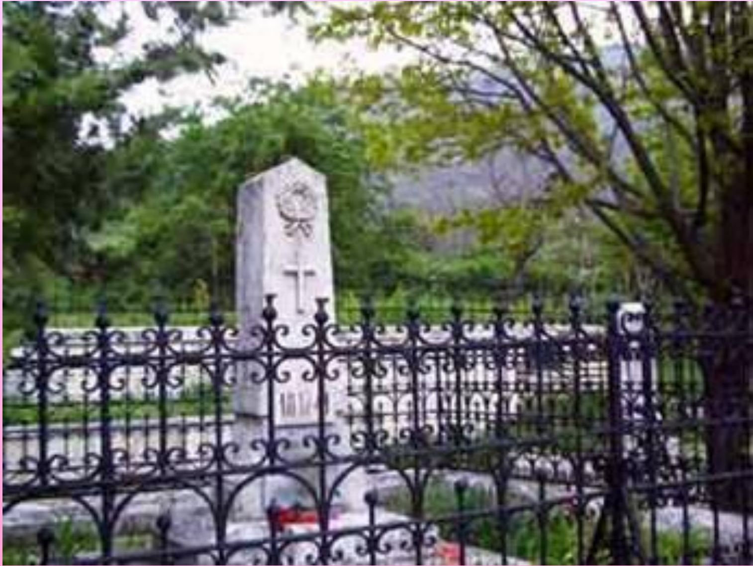
Место первоначального погребения Лермонтова в Пятигорском некрополе