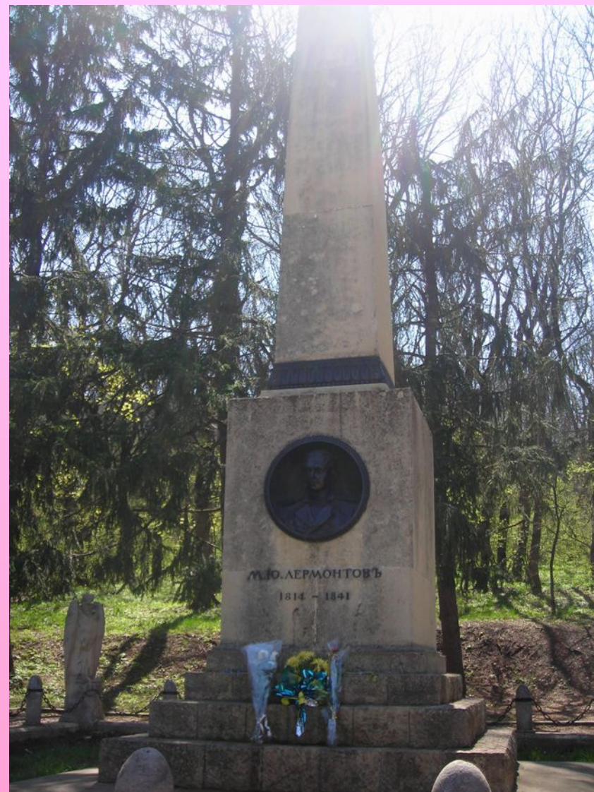
Памятник М.Ю. Лермонтову на месте дуэли