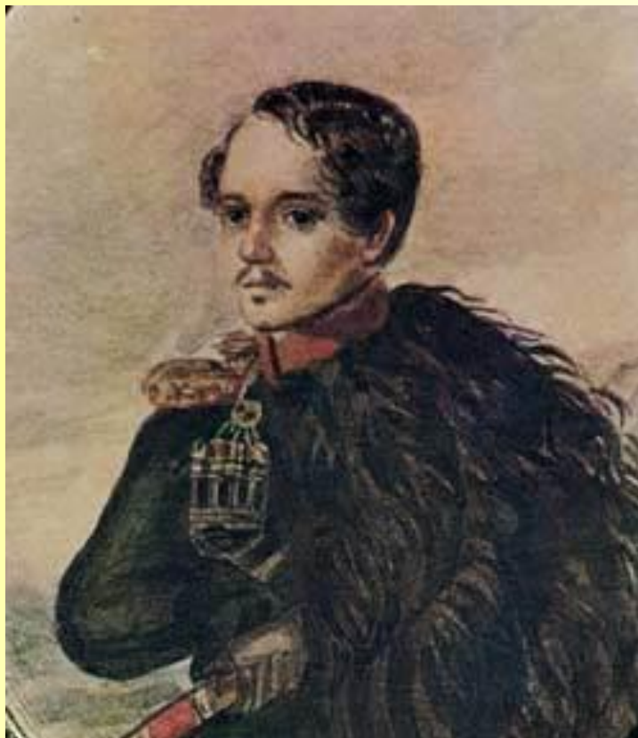
ЛЕРМОНТОВ Михаил Юрьевич