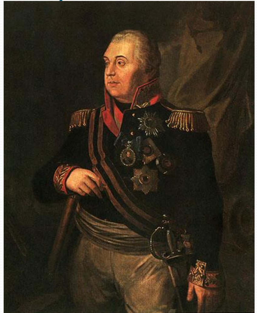
Р.Болков. Фельдмаршал М.И.Кутузов.

После сражения под Бородино по решению Михаил Илларионовича Кутузова русская армия для восстановления сил отступила и оставила Москву неприятелю. Наполеон отдал город на разграбление. Но вскоре в Москве вспыхнул пожар. Французы покинули город.