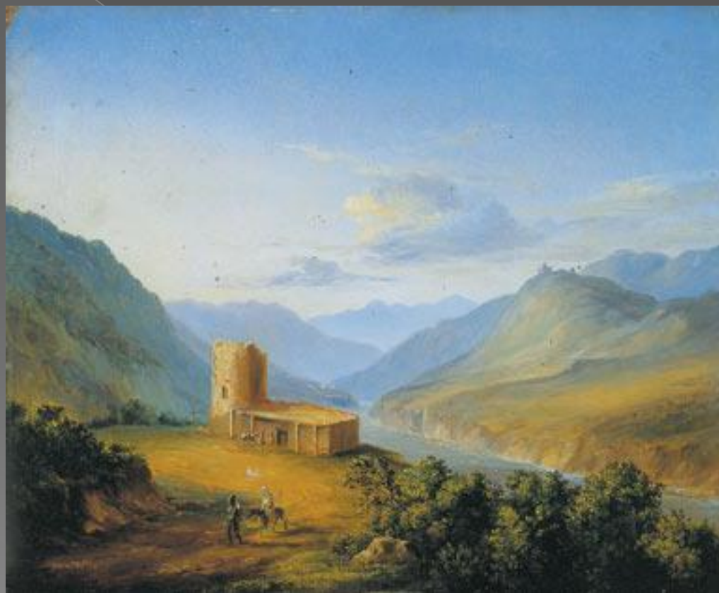
Военно-грузинская дорога близ Мцхета

"Горы кавказские для меня священны", - писал Лермонтов