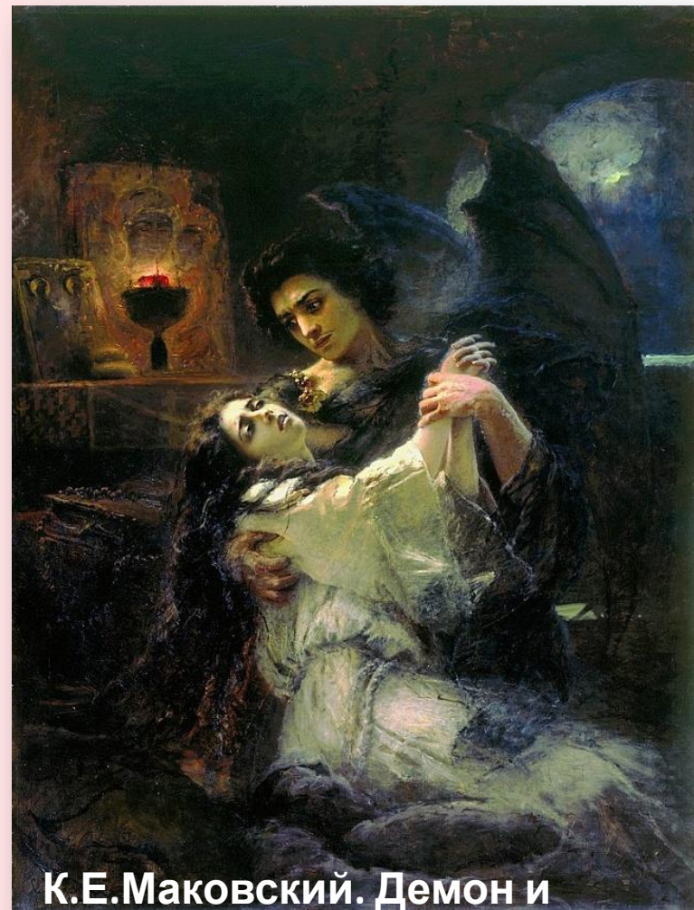
К.Е.Маковский. Демон и Тамара

И это далеко не все. Павел Висковатый пишет: «...поэма «Демон», особенно в первых очерках, вся проникнута изображением душевных бурь поэта и его любви к чудной девушке, от коей он ждал спасенья, в коей видел для себя оплот против мрачных дум и