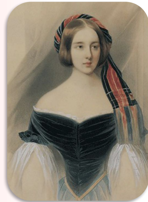
Гр. Воронцовой -Дашковой