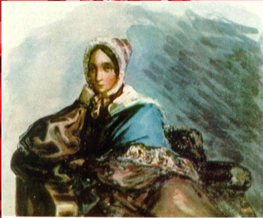
М.Лермонтов. Вера – героиня романа «Княгиня Лиговская» (портрет В.А. Лопухиной).