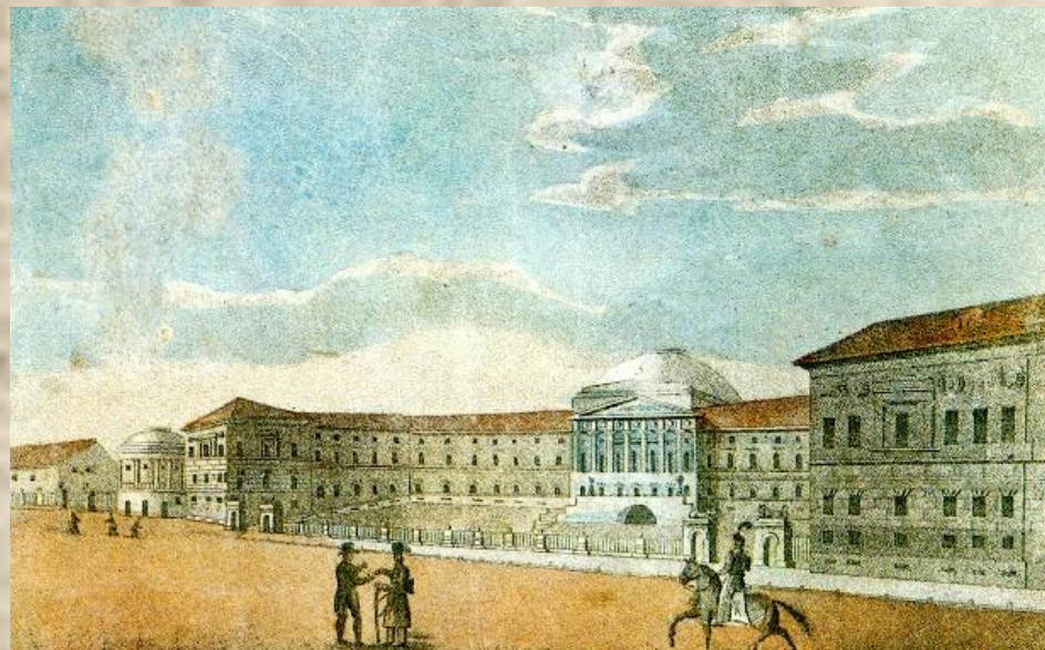
Московский университет. Неизвестный художник. 1820-е