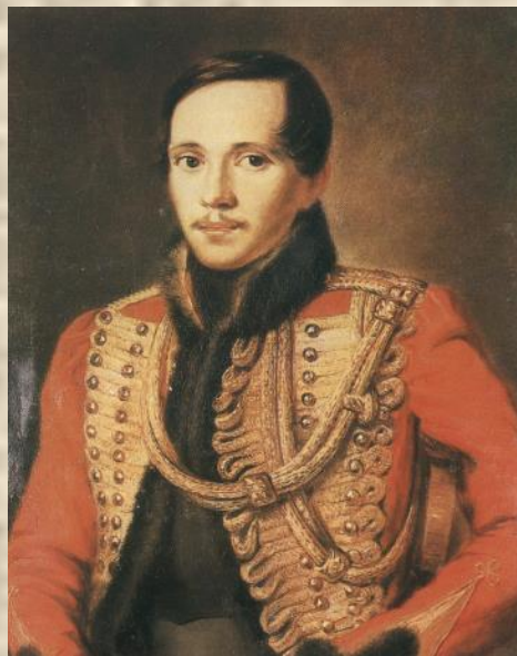
П. Е. Заболотский. Портрет М. Ю. Лермонтова.