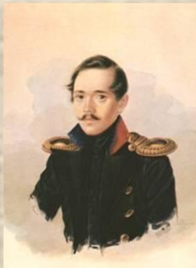
М.Ю.Лермонтов в сюртуке лейб-гвардии Гусарского полка. Акварель А.И.Клюндера.