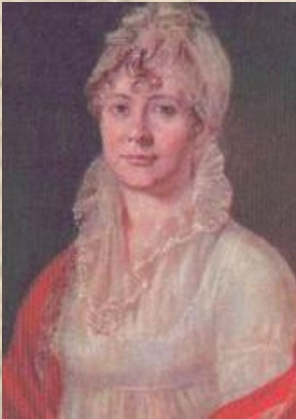
Е. А. Арсеньева, бабушка поэта.

После смерти матери Лермонтова бабушка сама занялась его воспитанием, полностью отстранив отца. Детство Лермонтова прошло в имении Арсеньевой Тарханы Пензенской губернии. Мальчик получил отличное домашнее образование, свободно владел французским и немецким языками, увлекался рисованием, музыкой.