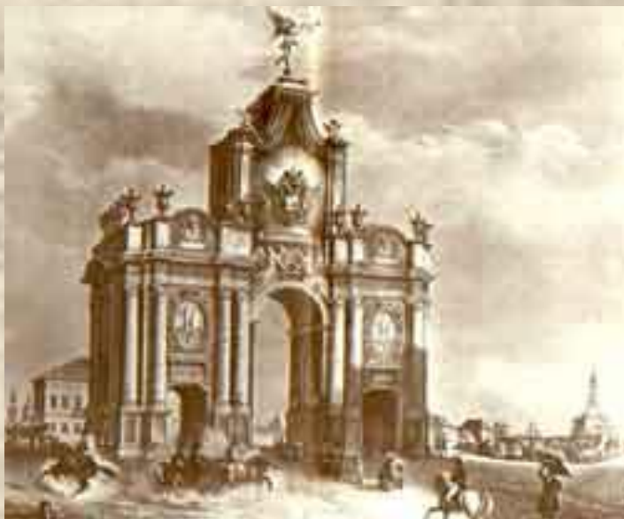
И.И. Вивьен. Москва. Красные ворота.

С 1827 года Лермонтов живет в Москве. Он учится в Московском благородном пансионе, позднее в Московском университете на нравственно-политическом, затем – на словесном отделении.