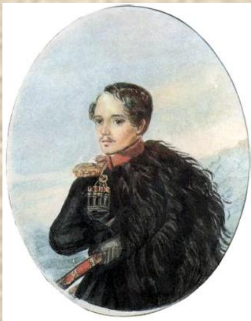
М. Ю. Лермонтов. Автопортрет.

В феврале 1837 года за стихотворение "Смерть поэта" М. Ю. Лермонтов был переведен в Нижегородский драгунский полк на Кавказ.