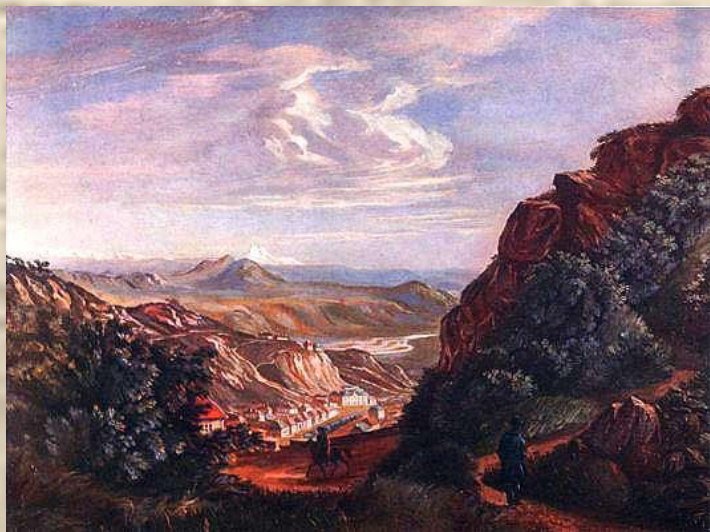
М. Ю. Лермонтов «Вид Пятигорска».

В 1840 году за дуэль с сыном французского посланника де Барантом М. Ю. Лермонтова вновь ссылают на Кавказ.