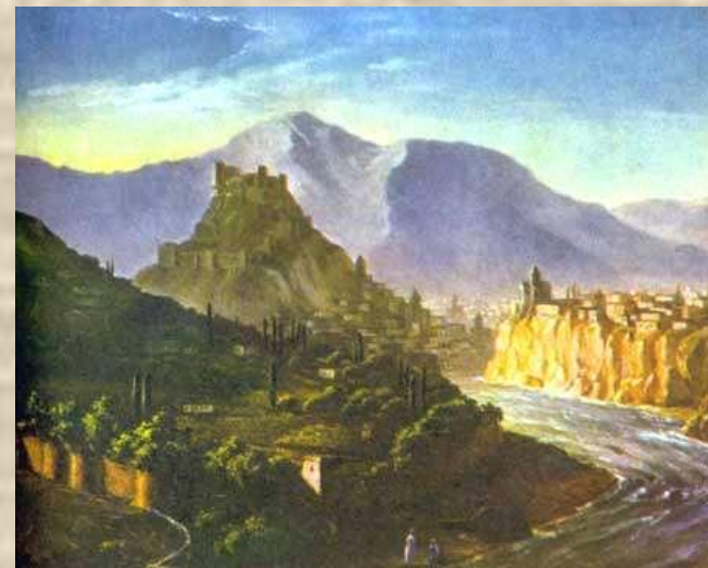
М. Ю. Лермонтов «Вид Тифлиса».