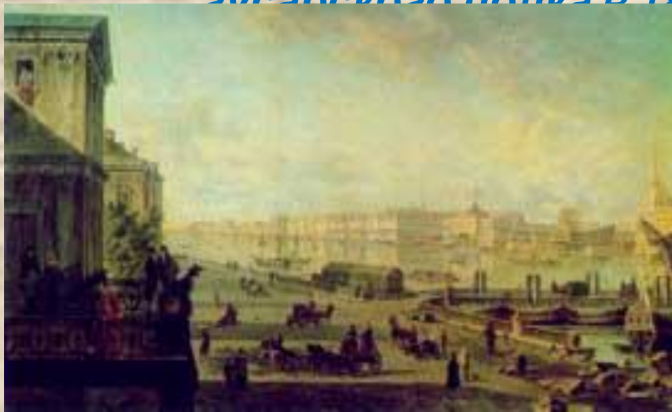
Петербург. 1820-е гг.

Оставив университет, Лермонтов в 1832 году переезжает в Петербург и поступает в Школу гвардейских подпрапорщиков и кавалерийских юнкеров; выпущен корнетом Лейб-гвардии эусарского полка в 1834 году