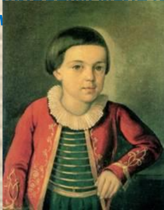
М. Ю. Лермонтов в детстве.