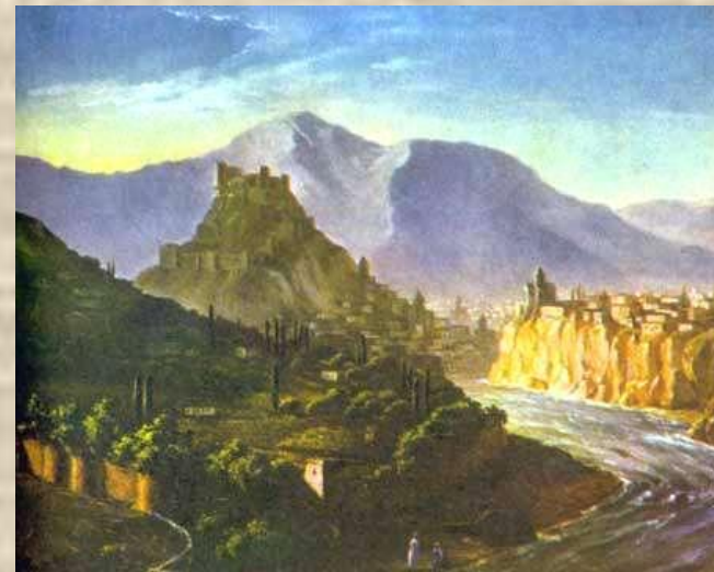
М. Ю. Лермонтов «Вид Тифлиса».