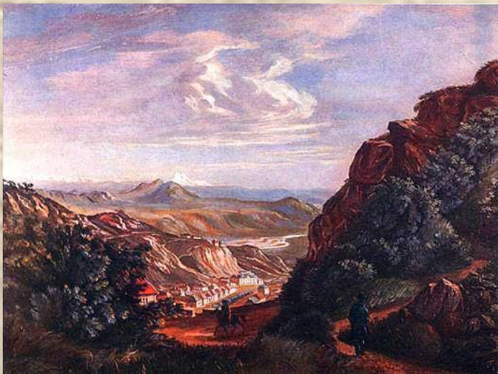
М. Ю. Лермонтов «Вид Пятигорска».

В 1840 году за дуэль с сыном французского посланника де Барантом М. Ю. Лермонтова вновь ссылают на Кавказ.