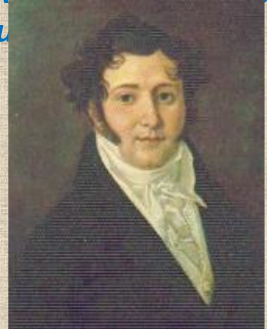
Ю. П. Лермонтов, отец поэта.