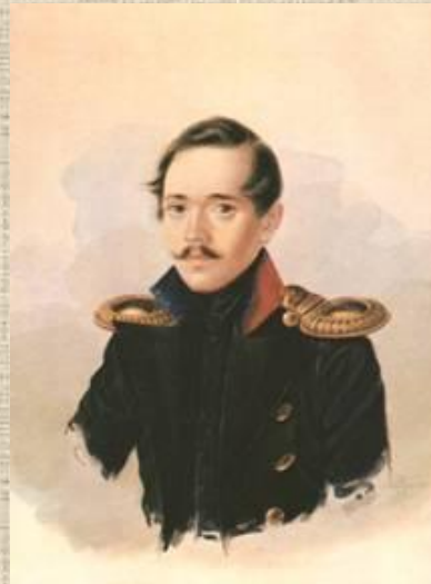
М.Ю.Лермонтов в сюртуке лейб-гвардии Гусарского полка. Акварель А.И.Клюндера.