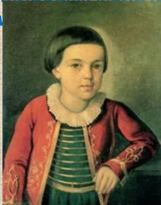
М. Ю. Лермонтов в детстве.