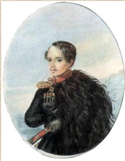
М. Ю. Лермонтов. Автопортрет.

В феврале 1837 года за стихотворение "Смерть поэта" М. Ю. Лермонтов был переведен в Нижегородский драгунский полк на Кавказ.