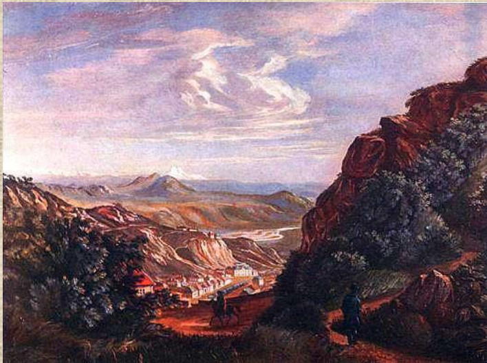
М. Ю. Лермонтов «Вид Пятигорска».

В 1840 году за дуэль с сыном французского посланника де Барантом М. Ю. Лермонтова вновь ссылают на Кавказ.