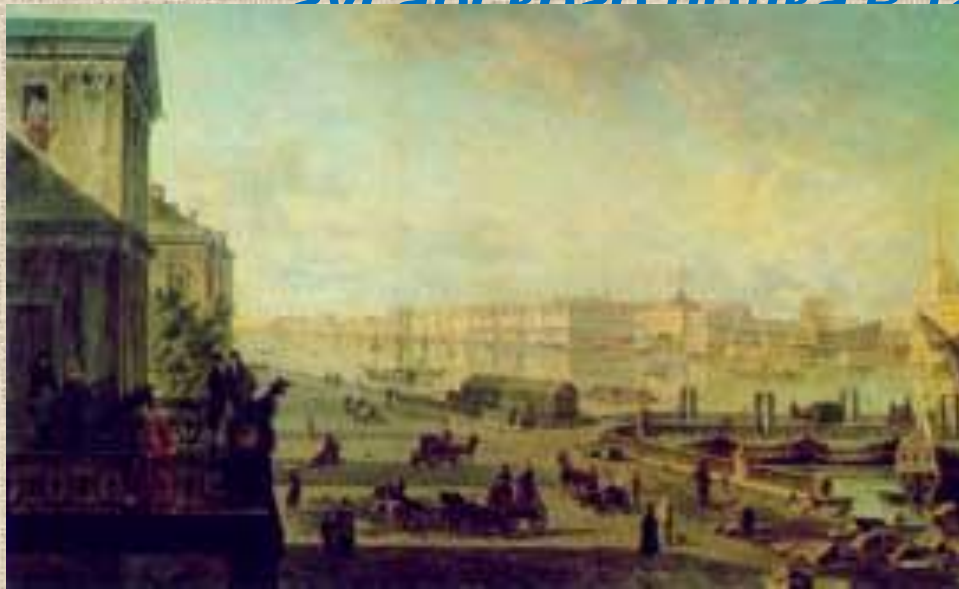
Петербург. 1820-е гг.

Оставив университет, Лермонтов в 1832 году переезжает в Петербург и поступает в Школу гвардейских подпрапорщиков и кавалерийских юнкеров; выпущен корнетом Лейб-гвардии гусарского полка в 1834 году