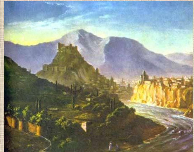
М. Ю. Лермонтов «Вид Тифлиса».