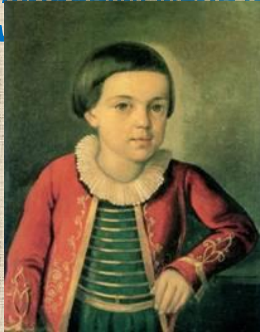
М. Ю. Лермонтов в детстве.