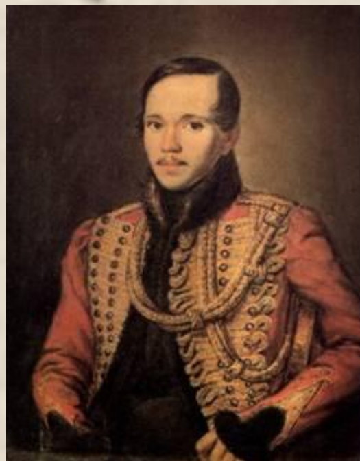
П.Е. Заболотский Портрет М.Ю. Лермонтова 1837 год