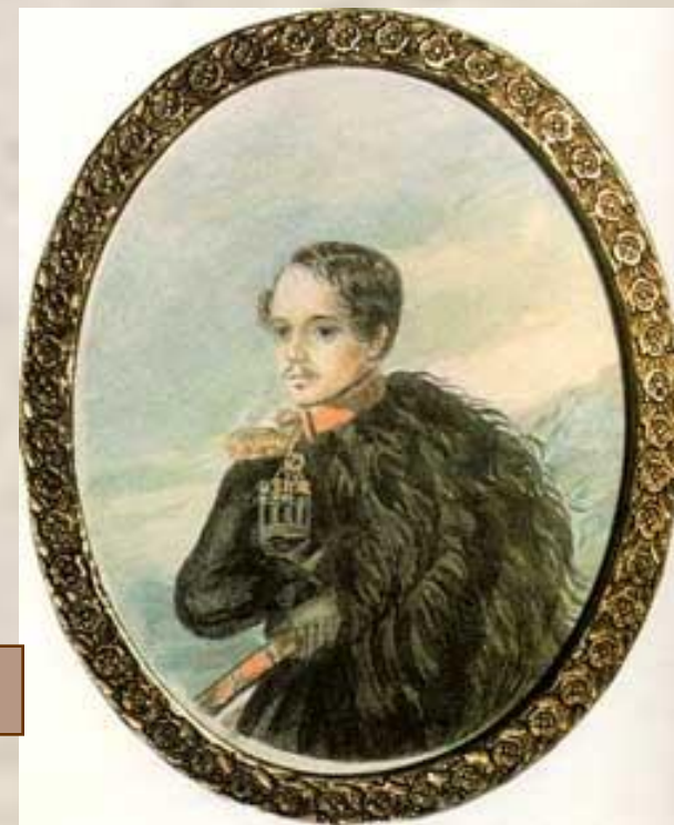
Автопортрет 1837 год