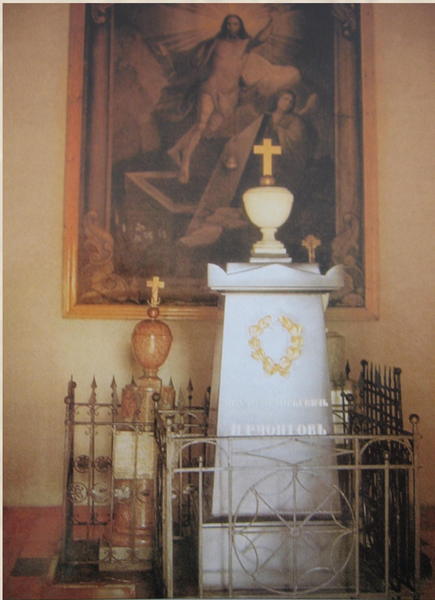
Памятник над могилой М.Ю.Лермонтова