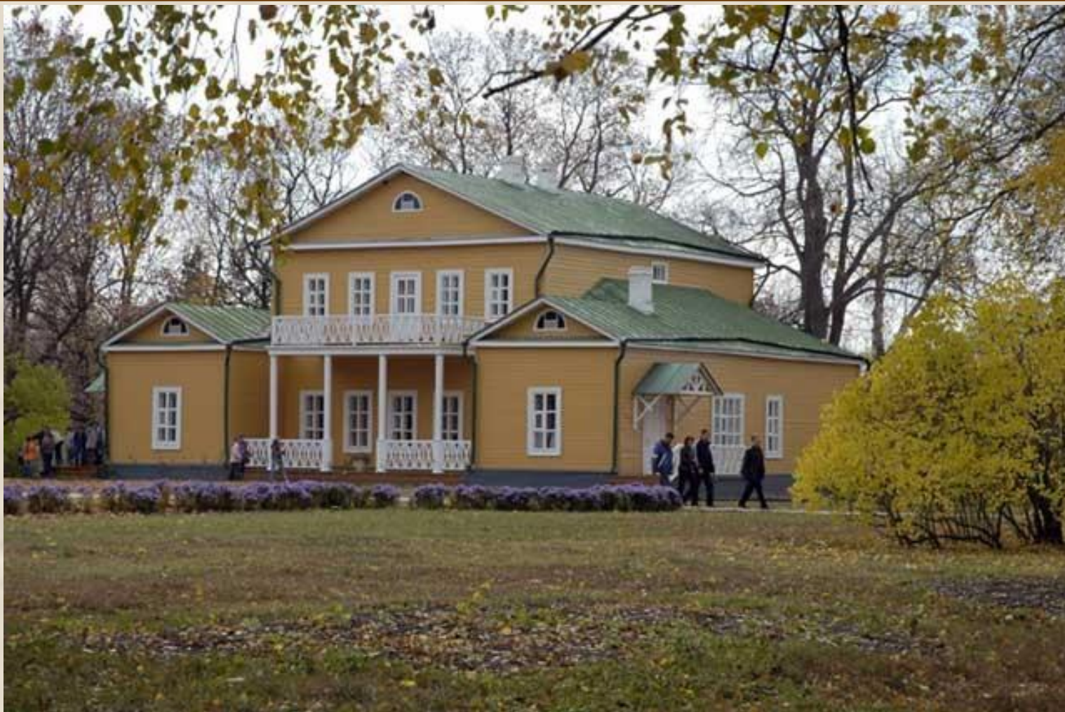
Дом в Тарханах, где прошло детство Лермонтова