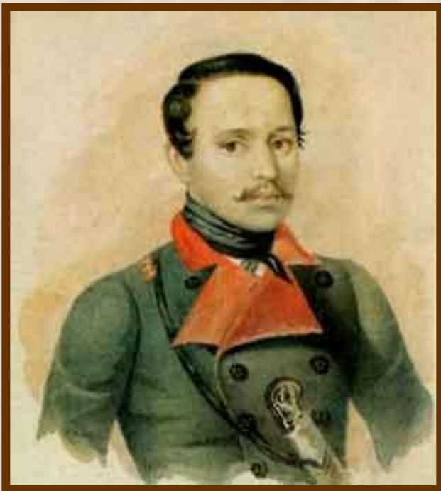
Портрет Заболотского ( 1840)

В.А. Фаворский (1931) создал портрет– композицию Лермонтова