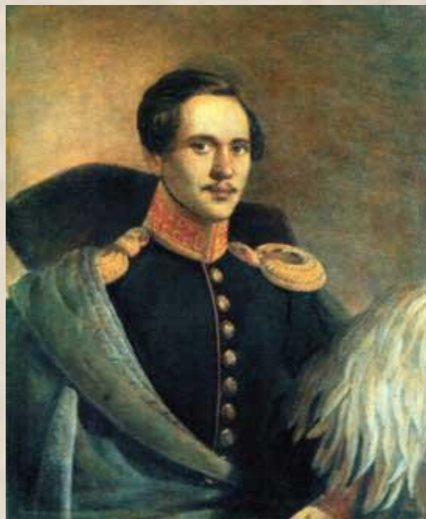
Ф.О Будкин «Лермонтов в вицмундире лейб-гвардейского гусарского полка» 1834 год