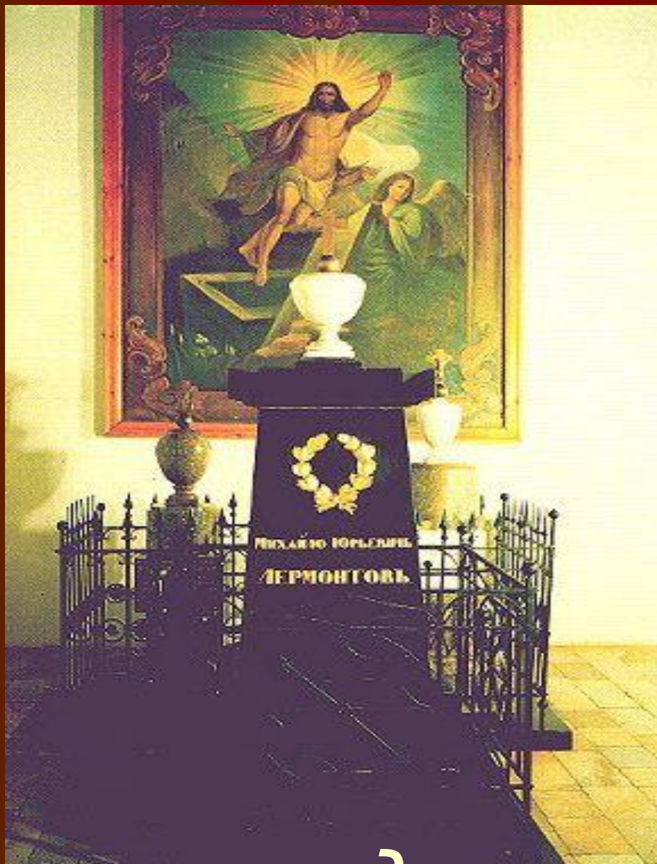
Памятник над могилой М.Ю. Лермонтова.