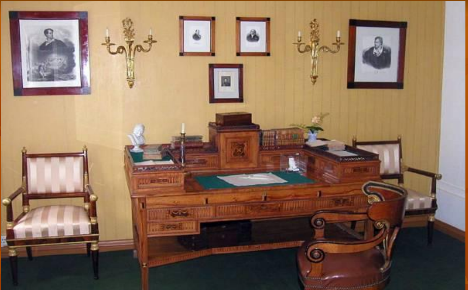
Рабочий кабинет поэта в Тарханах.