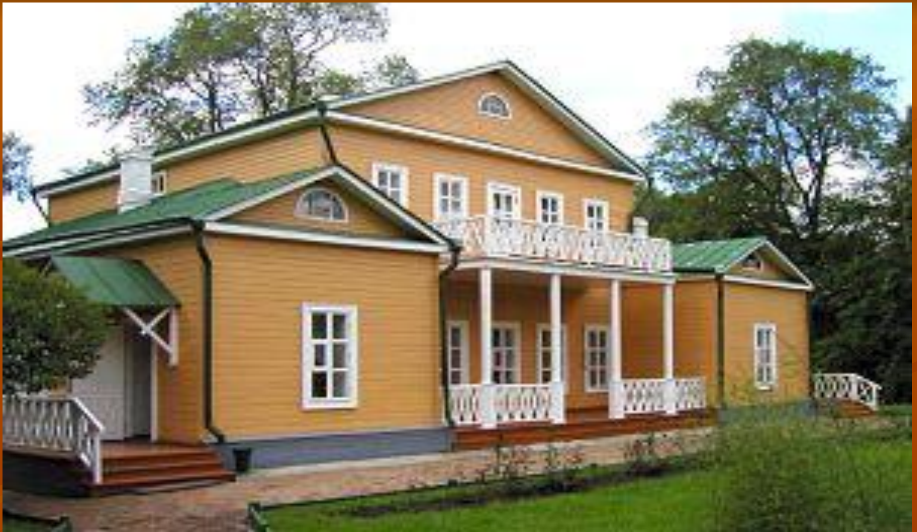
Дом-музей М.Ю.Лермонтова в Тарханах.