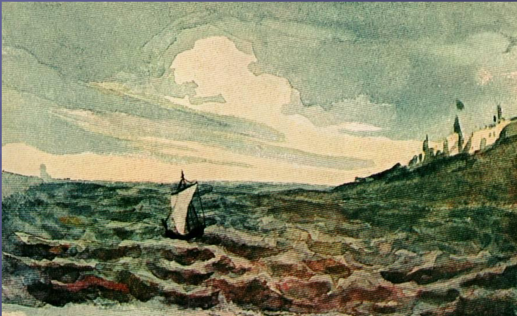
«Парус». Акварель Лермонтова.