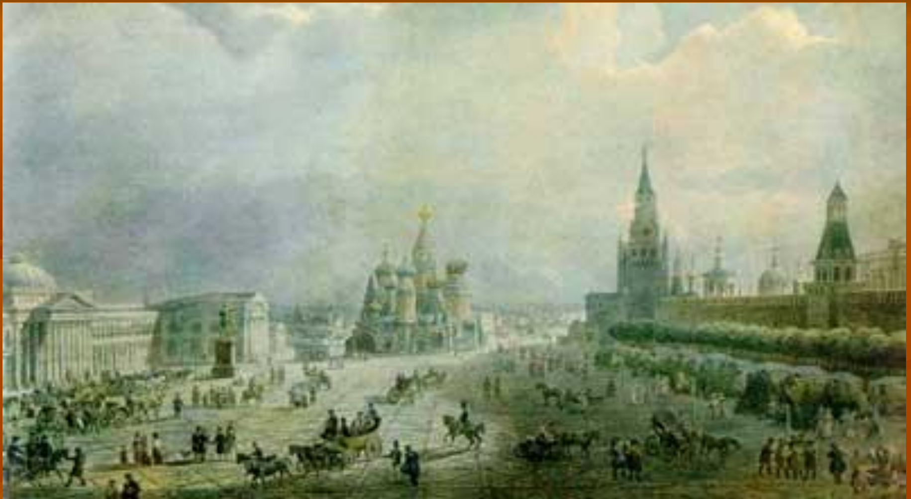
Панорама Москвы 1820-е годы.