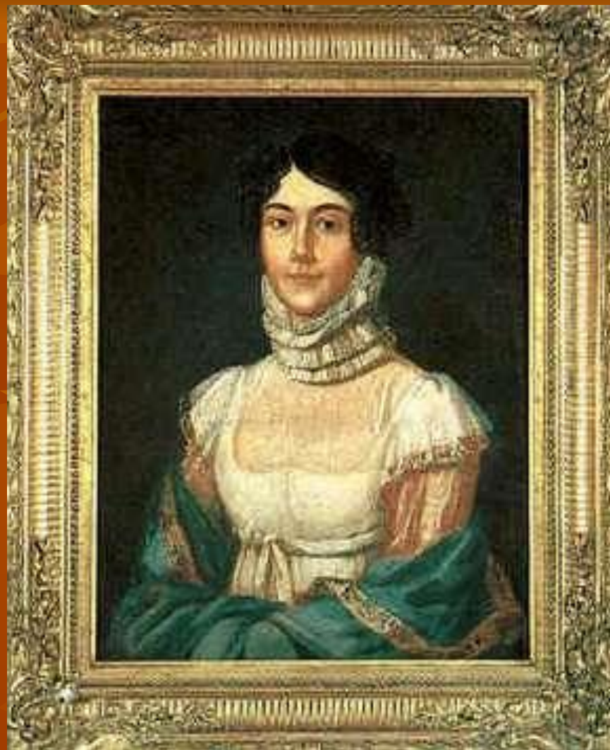
Ю.П.Лермонтов. М.М.Арсеньева (Лермонтова).