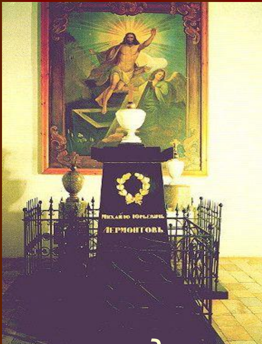
Памятник над могилой М.Ю. Лермонтова.