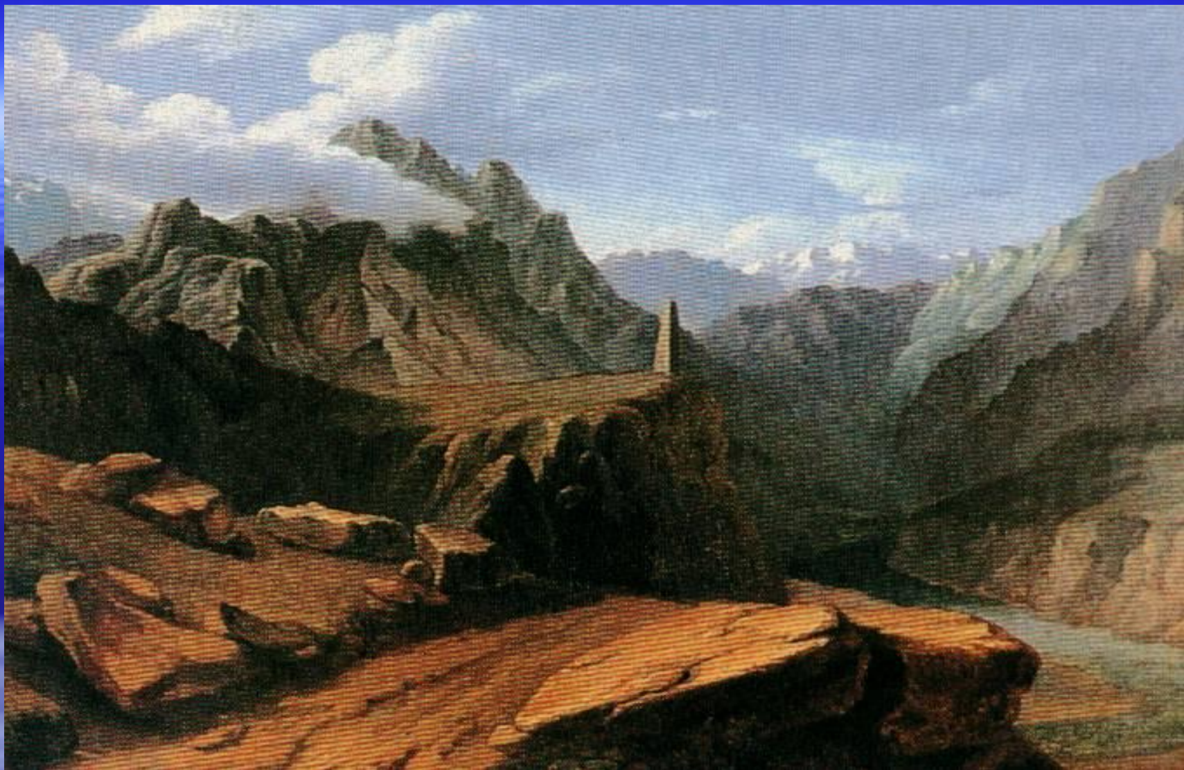
Кавказ. Акварель М.Ю.Лермонтова.