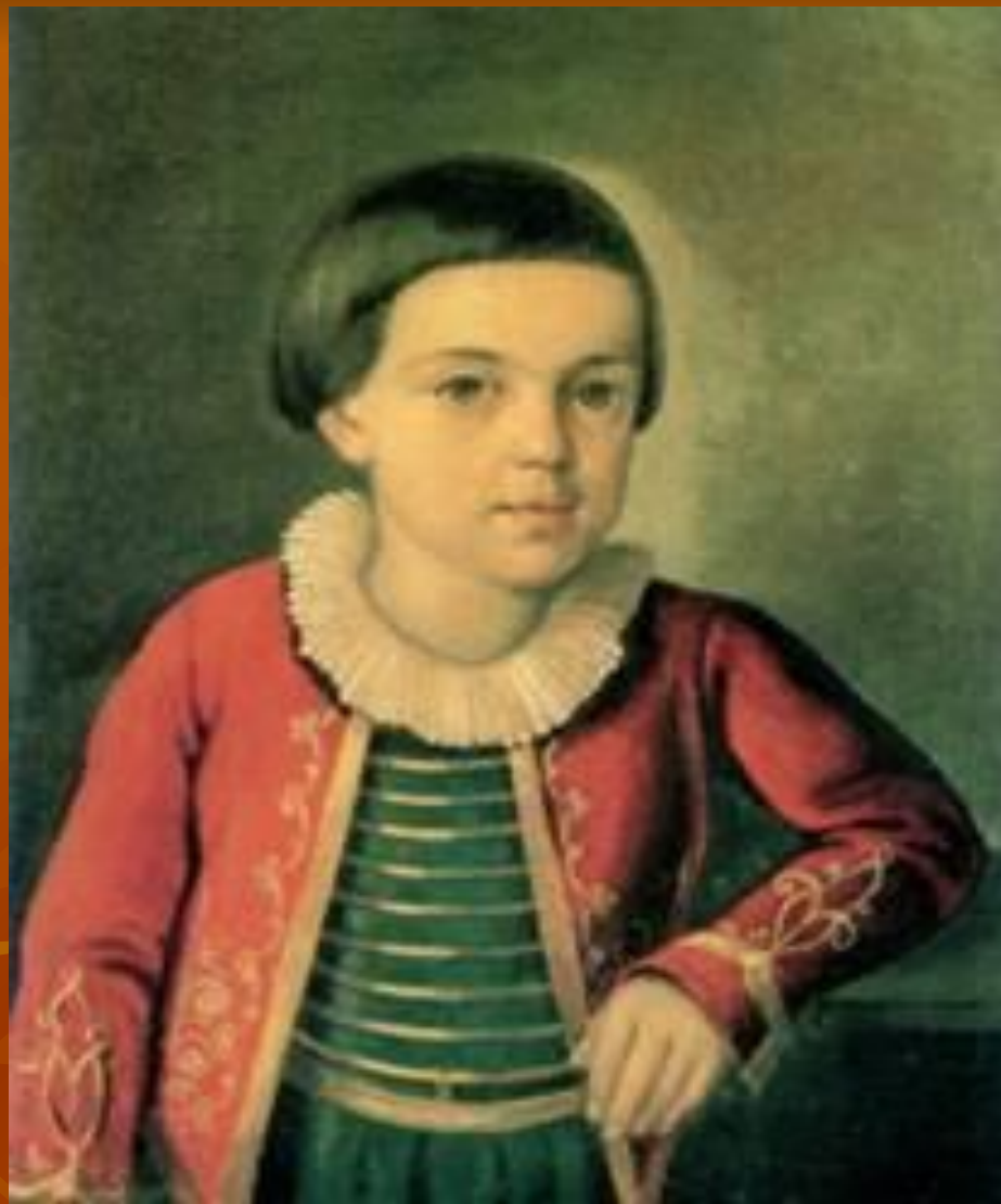
М.Ю.Лермонтов в детстве. Неизвестный художник. 1820-1822 гг.