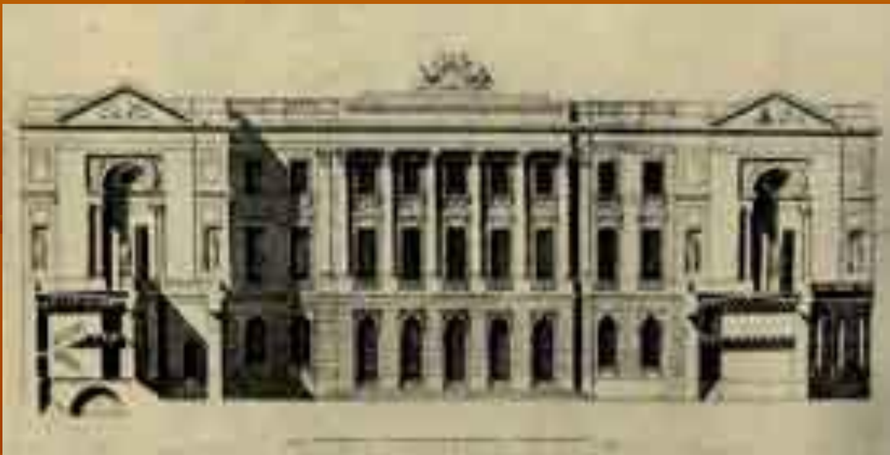
Петербург. Школа гвардейских подпрапорщиков и кавалерийских юнкеров.