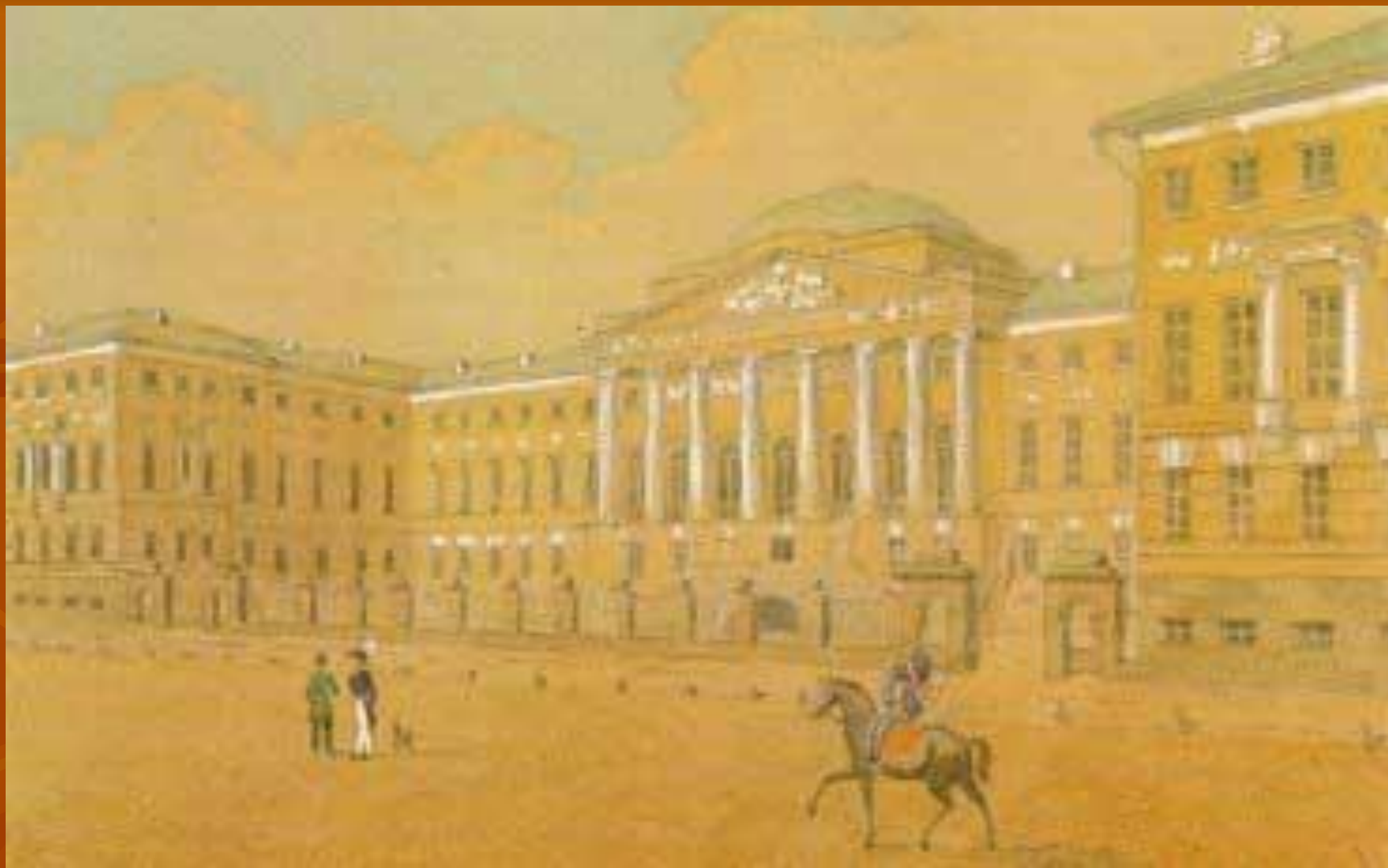
Москва. Благородный пансион при Московском университете.