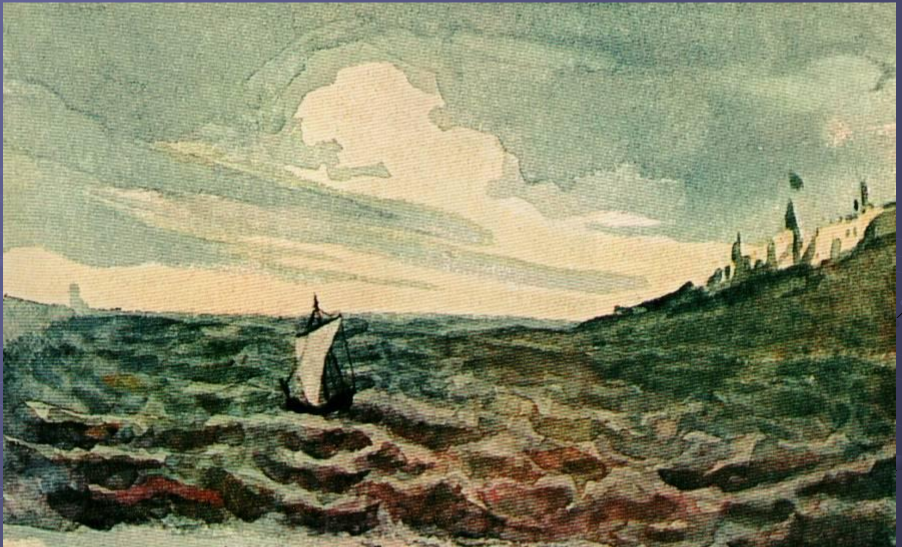
«Парус». Акварель Лермонтова.