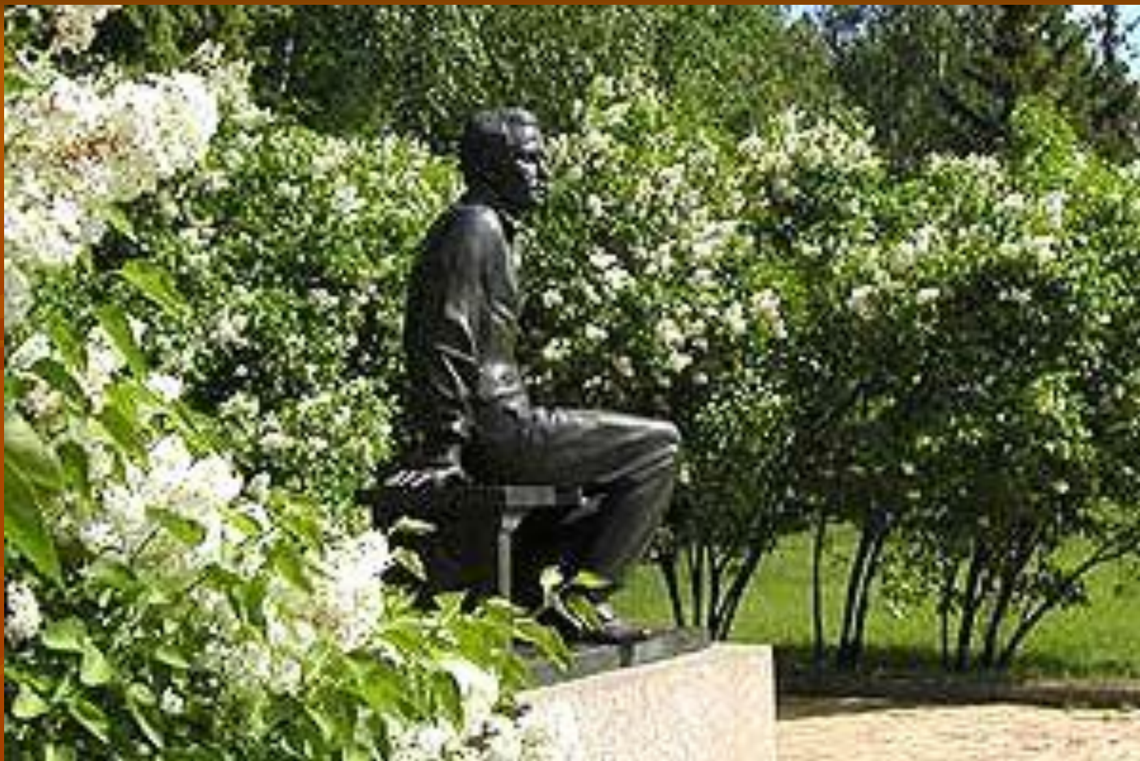
Памятник М.Ю.Лермонтову в Тарханах.