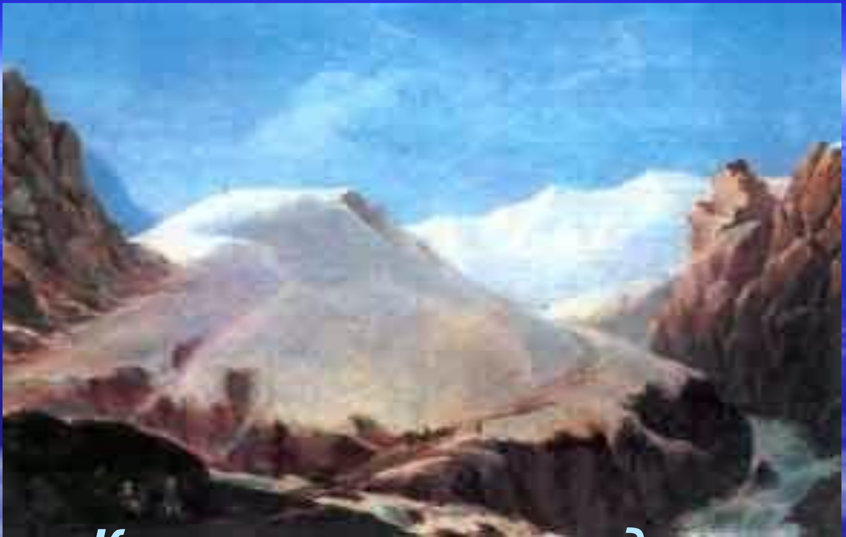
«Крестовая гора» - одна из лучших работ М.Ю. Лермонтова. 1837 год.