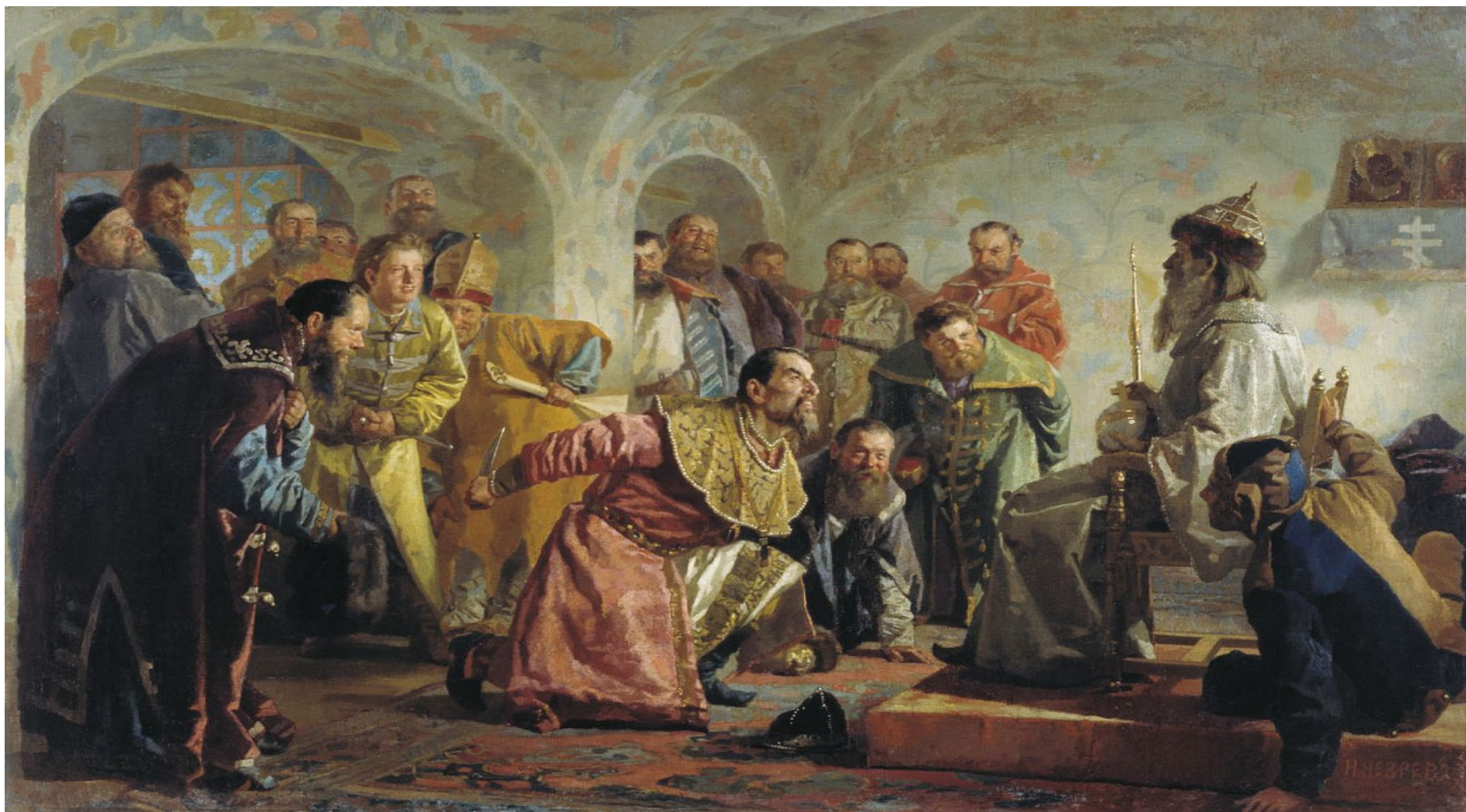
Николай Васильевич Неврев, картина Опричники.