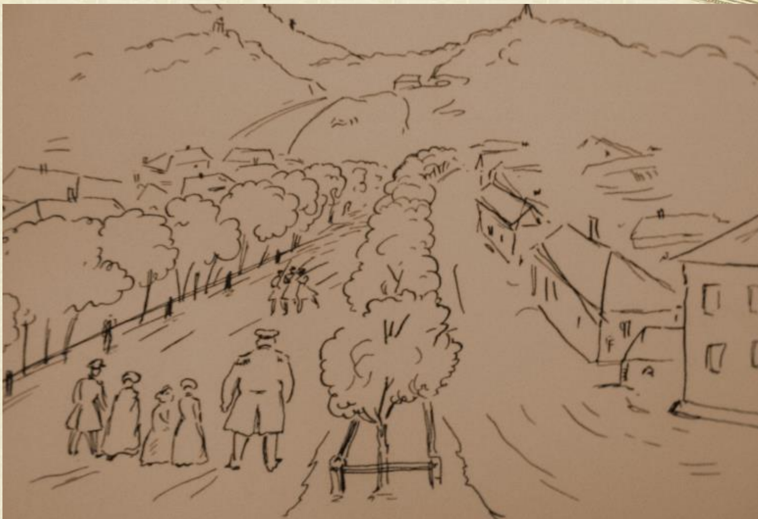
Вид пятигорского бульвара. Лермонтов М.Ю.1840г. Рисунок.