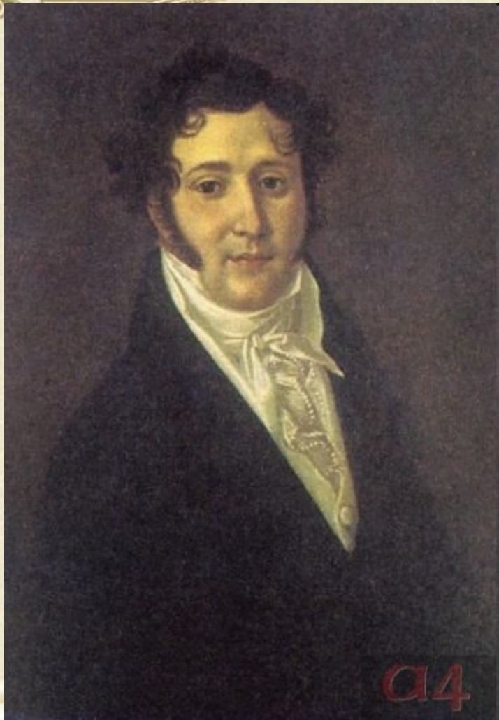
Ю. П. Лермонтов, отец поэта. Портрет работы неизвестного художника. Масло, 1810-е гг.

По мужской линии род Лермонтовых ведет свое начало от Георга Лермонта (Шотландия). Отец поэта — Юрий Петрович Лермонтов, капитан в отставке из небогатых помещиков Тульской губернии. Находясь на службе у польского короля, в 1613 г. Лермонт перешел на сторону русских, сражался в чине офицера в отряде Дмитрия Пожарского и в 1621 г. за хорошую службу царю получил грамоту на владение землей в Галическом уезде Костромской губернии. От него и пошли Лермонтовы, уже во втором колене принявшие Православие.