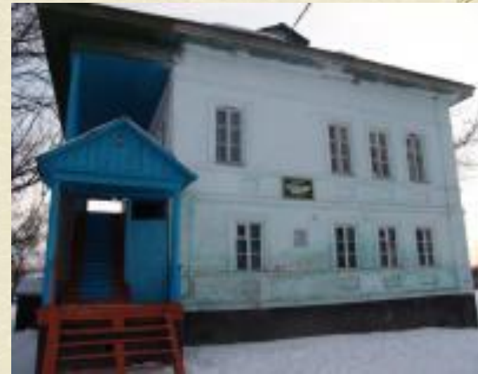
Дом в селе Парабоч, а теперь и Литературный музей М.Ю. Лермонтова