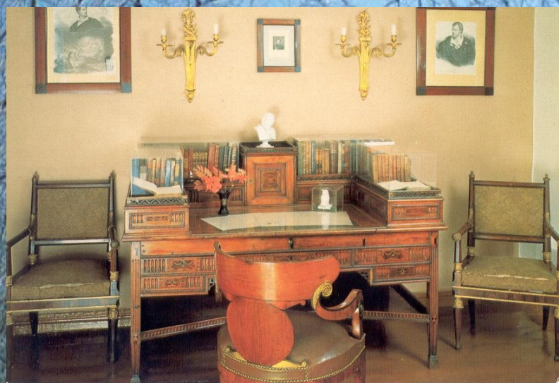
Кабинет М.Ю. Лермонтова