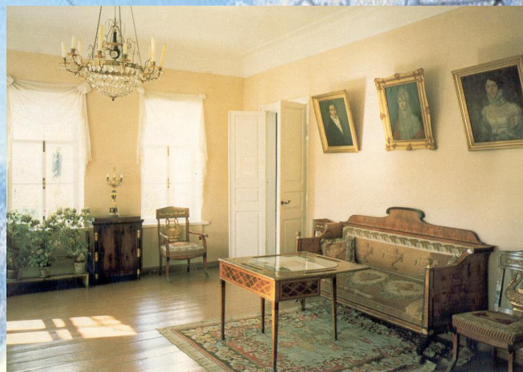
Зала в имени Лермонтовых