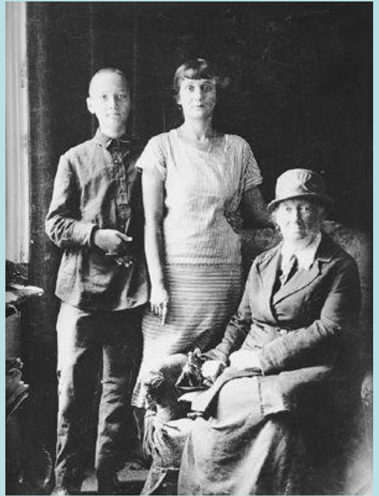
Л. Н. Гумилев, А. А. Ахматова, А. И. Гумилева в Фонтанном доме, г. Ленинград (середина 20-х годов XX в.)