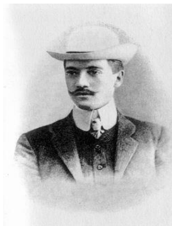
НИКОЛАЙ СТЕПАНОВИЧ ГУМИЛЕВ (1886 – 1921)

«Еще не раз Вы вспомните меня И весь мой мир, волнующий и странный...»