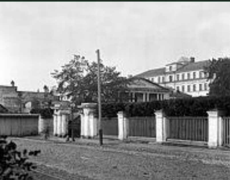
Двор дома на Никитском бульваре

21 февраля утром Гоголь умер в своей последней квартире в доме Талызина в Москве.