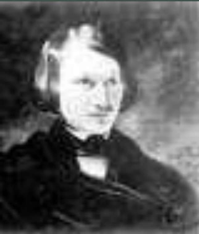
Портрет писателя работы художника Ф.А. Моллера

21 февраля 1852 года Гоголя не стало. В память о друге Аксаков заказал для себя копию с его портрета, написанного Ф.А. Моллером, которая хранится в музее. Об этом портрете еще при жизни Гоголя Аксаков писал: "Таким бывает Гоголь в счастливые минуты творчества".