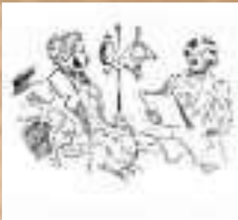
Гоголь и Пушкин

Вскоре после постановки "Ревизора", затравленный реакционной печатью и "светской чернью". Гоголь уехал в Германию, конец лета провёл в Швейцарии, затем поселился в Париже, продолжая работу над "Мертвыми душами", начатую в России. Известие о гибели Пушкина было для него страшным ударом. В марте 1837 поселился в Риме. Во время приезда в Россию в 1839 - 40 читал друзьям главы из первого тома "Мертвых душ", который был завершен в Риме в 1840 - 41.