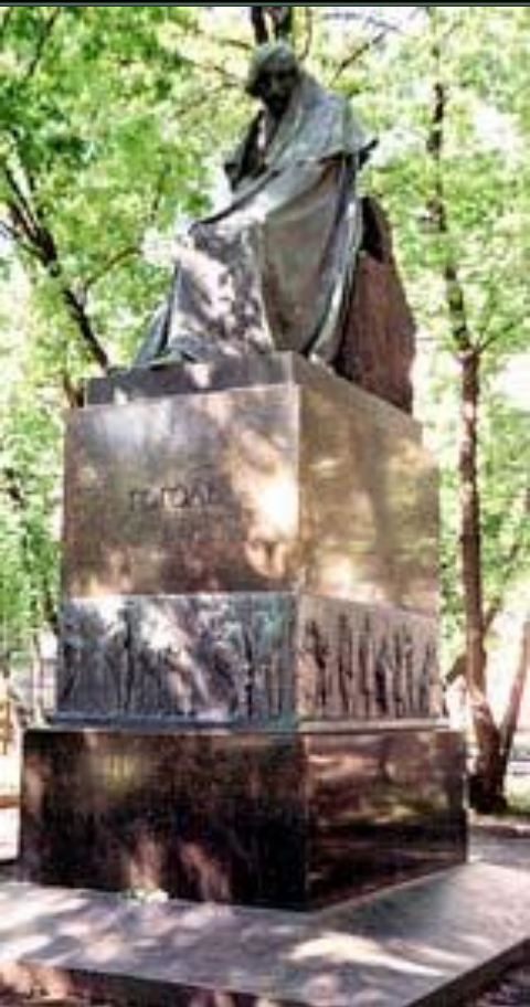
Памятник Гоголю во дворе дома Талызина на Никитском бульваре. Скульптор Н. Андреев. 1909 г.