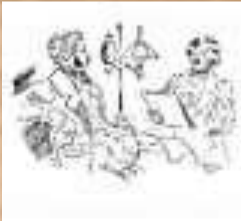
Гоголь и Пушкин

Вскоре после постановки "Ревизора", затравленный реакционной печатью и "светской чернью". Гоголь уехал в Германию, конец лета провёл в Швейцарии, затем поселился в Париже, продолжая работу над "Мертвыми душами", начатую в России. Известие о гибели Пушкина было для него страшным ударом. В марте 1837 поселился в Риме. Во время приезда в Россию в 1839 - 40 читал друзьям главы из первого тома "Мертвых душ", который был завершен в Риме в 1840 - 41.