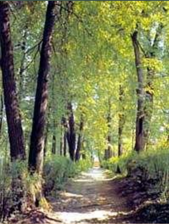
Аллея Гоголя в Абрамцеве

В 1832 году Гоголь познакомился с русским писателем С. Т. Аксаковым. С тех пор Гоголь всей душой был привязан к семье Аксаковых. Дружба их продолжалась двадцать лет, до конца его жизни. 14 августа 1849 года Гоголь впервые приехал в Абрамцево. Оно полюбилось ему.