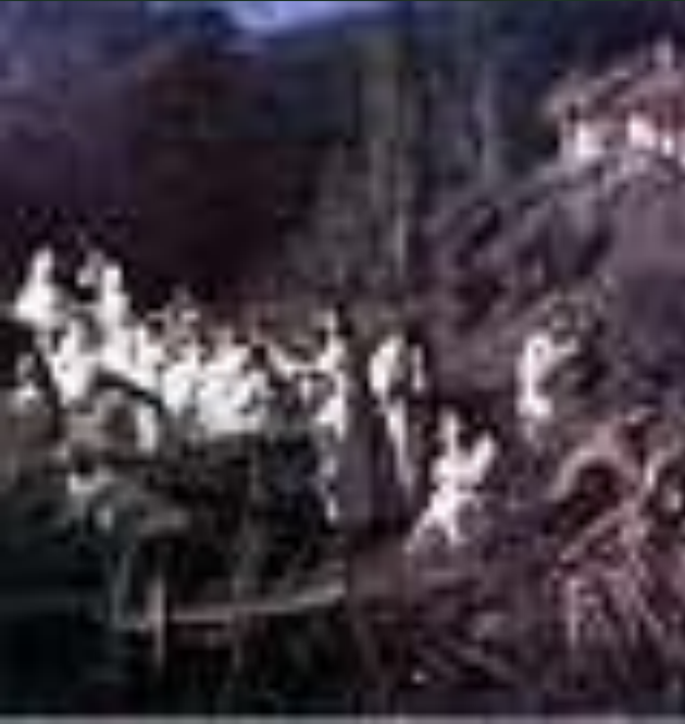
«Майская ночь, или Утопленница»

Литературную известность Гоголю принесли "Вечера на хуторе близ Диканьки" (1831 - 1832), повести "Сорочинская ярмарка", "Майская ночь" и др. В 1833 пришел к решению посвятить себя научной и педагогической работе и в 1834 был назначен адъюнкт-профессором по кафедре всеобщей истории при Санкт-Петербургском университете.