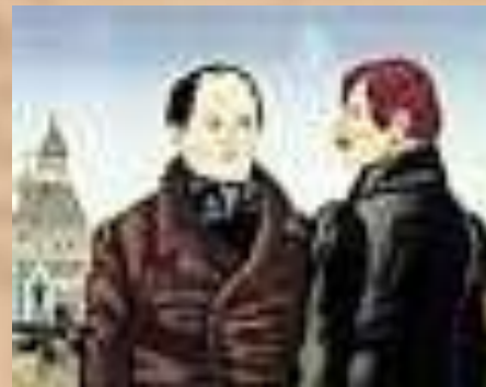
Гоголь и Щепкин

Осенью 1835 г. он принимается за написание "Ревизора", сюжет которого подсказан был Пушкиным; работа продвигалась столь успешно, что 18 января 1836 г. он читает комедию на вечере у Жуковского (в присутствии Пушкина, П. А. Вяземского и других), а в феврале-марте уже занят ее постановкой на сцене Александрийского театра. Премьера пьесы состоялась 19 апреля. 25 мая - премьера в Москве, в Малом театре с участием Щепкина.