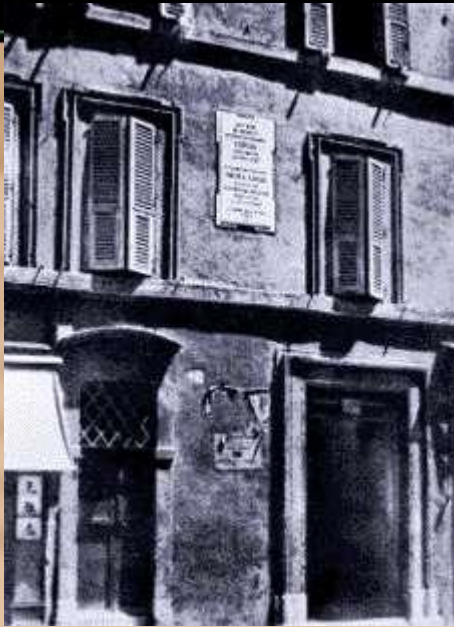
Дом Гоголя в Риме

1842-1845 гг. - период напряженной и трудной работы над 2-м томом "Мертвых душ".