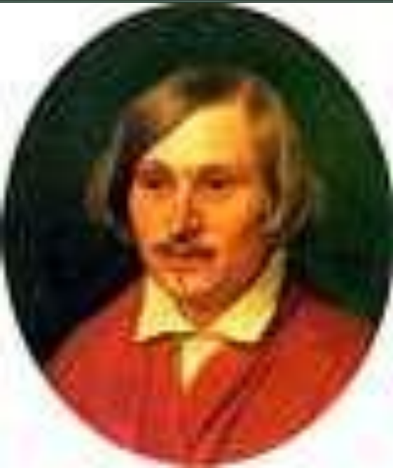
Портрет А.А. Иванова. 1841 г.

В Риме Гоголь часто посещает дом княгини Зинаиды Волконской. Он высоко ценил её радушие и кулинарные способности. Когда княгини не было в городе, Гоголь чувствовал себя сиротливо. У Волконской в 1838 году писатель познакомился и подружился с художником Ивановым, картина которого "Явление Христа народу" выставлена в Третьяковской галерее.