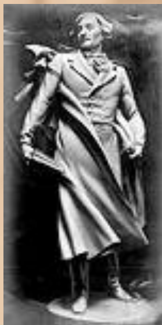
Проект Меркулова памятника Гоголю