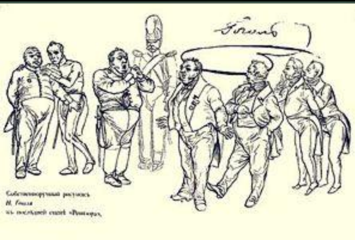
Собственноручный рисунок Н.В. Гоголя к последней сцене "Ревизора"