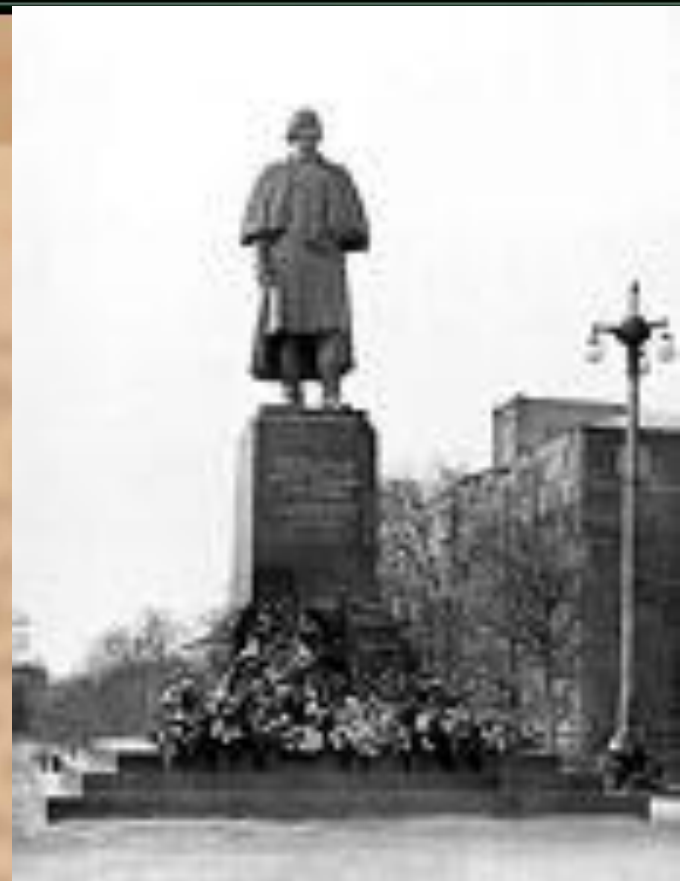
Памятник Гоголю. Томский