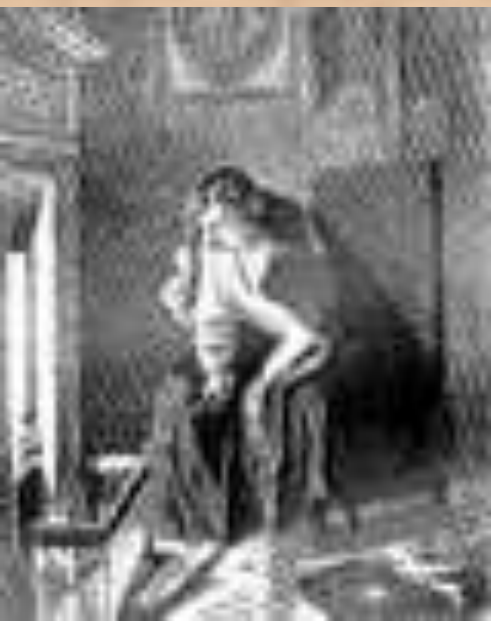
Гоголь сжигает вторую часть "Мёртвых душ"

1 января 1852 г. Гоголь сообщает Арнольди, что 2-й том "совершенно окончен". Но в последних числах месяца явственно обнаружались признаки нового кризиса, толчком к которому послужила смерть Е. М. Хомяковой, сестры Н. М. Языкова, человека, духовно близкого Гоголю. Его терзает предчувствие близкой смерти, усугубляемое вновь усилившимися сомнениями в благотворности своего писательского поприща и в успехе осуществляемого труда. 7 февраля Гоголь исповедуется и причащается, а в ночь с 11 на 12 сжигает беловую рукопись 2-го тома (сохранилось в неполном виде лишь 5 глав, относящихся к различным черновым редакциям; опубликованы в 1855 г.).