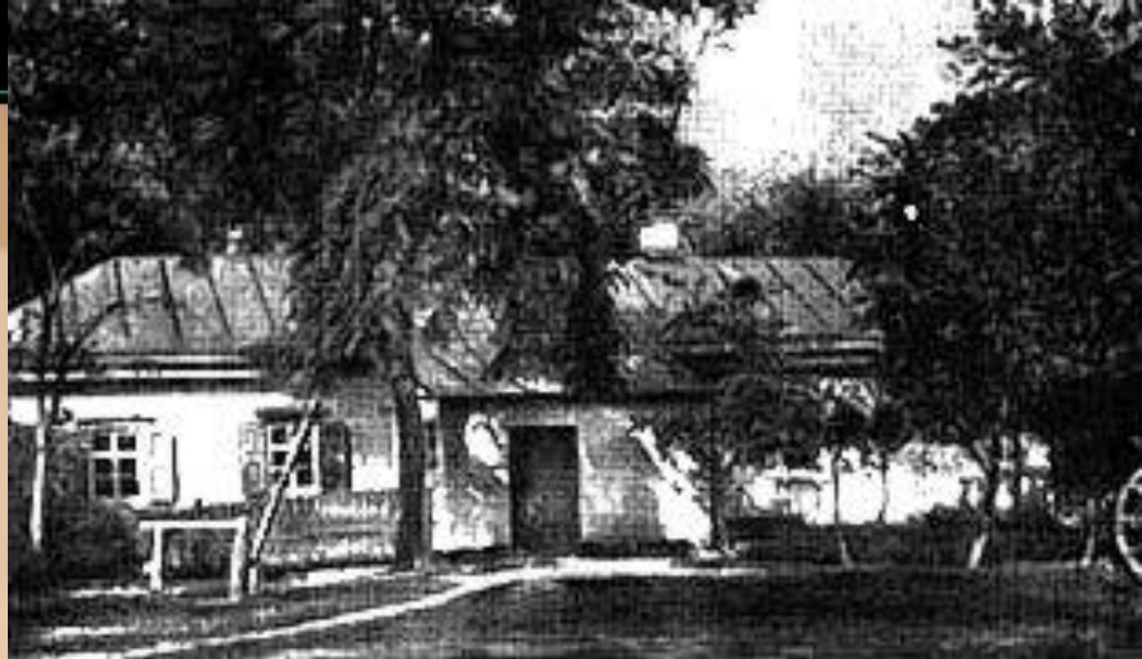
Дом доктора М.Я.Трохимовского в Сорочинцах, где родился Гоголь

Н. В. Гоголь родился 20 марта 1809 года в местечке Великие Сорочинцы Миргородского уезда Полтавской губернии в семье небогатого помещика. Назвали Николаем в честь чудотворной иконы святого Николая, хранившейся в церкви села Диканька.