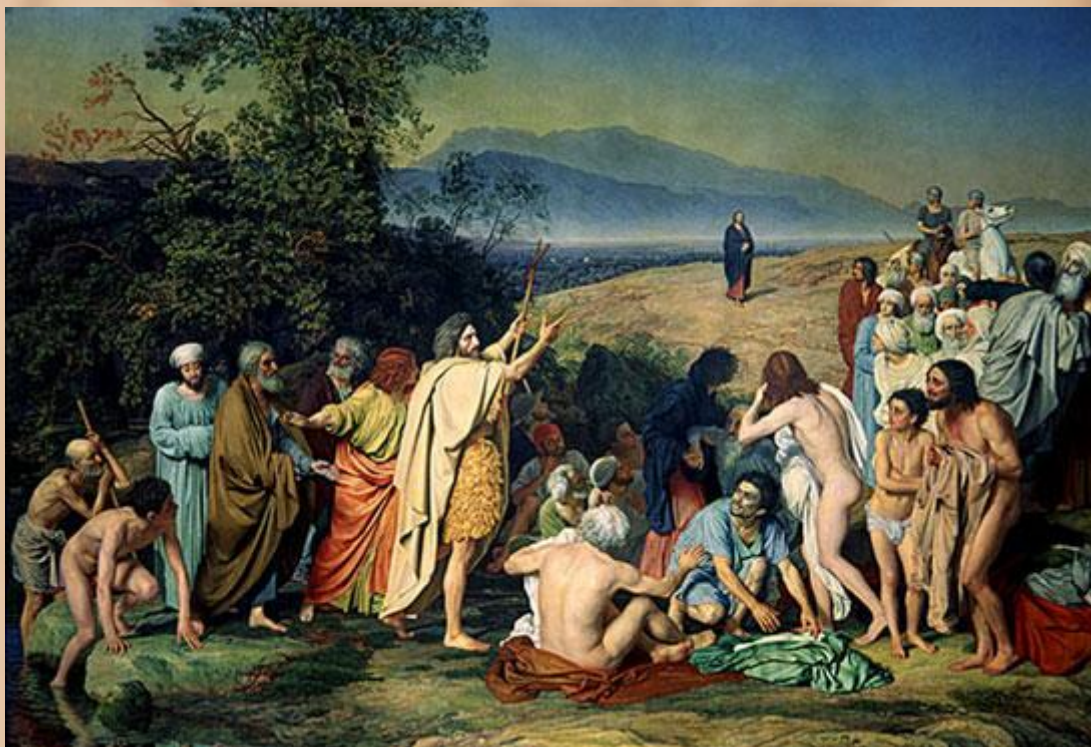
А. А. Иванов «Явление Христа народу» 1837 - 1857 гг.