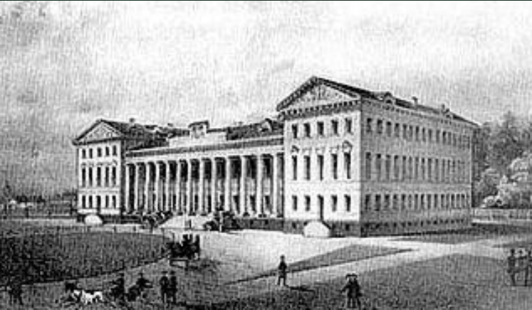
Нежин. Гимназия высших наук

После домашнего образования Гоголь провел два года в Полтавском уездном училище, затем поступил в Нежинскую гимназию высших наук, созданную по типу Царскосельского лицея для детей провинциального дворянства. Здесь учится играть на скрипке, занимается живописью, участвует в спектаклях, исполняя комические роли. Думая о своем будущем, останавливается на юстиции, мечтая "пресекать неправосудие".