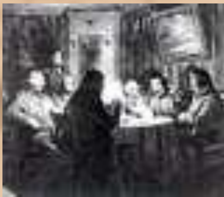
Н.В. Гоголь читает "Ревизора" 5 ноября 1851 года в доме на Суворовском бульваре в Москве

Осенью 1835 г. он принимается за написание "Ревизора", сюжет которого подсказан был Пушкиным; работа продвигалась столь успешно, что 18 января 1836 г. он читает комедию на вечере у Жуковского (в присутствии Пушкина, П. А. Вяземского и других), а в феврале-марте уже занят ее постановкой на сцене Александрийского театра. Премьера пьесы состоялась 19 апреля. 25 мая - премьера в Москве, в Малом театре с участием Щепкина.