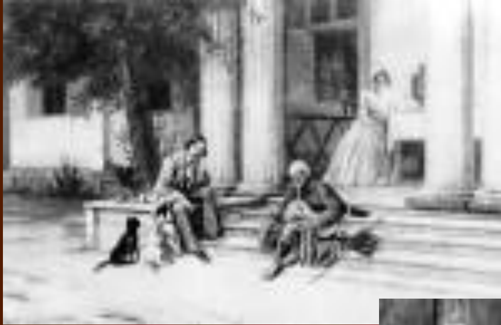
Н.В. Гоголь в Яновщине