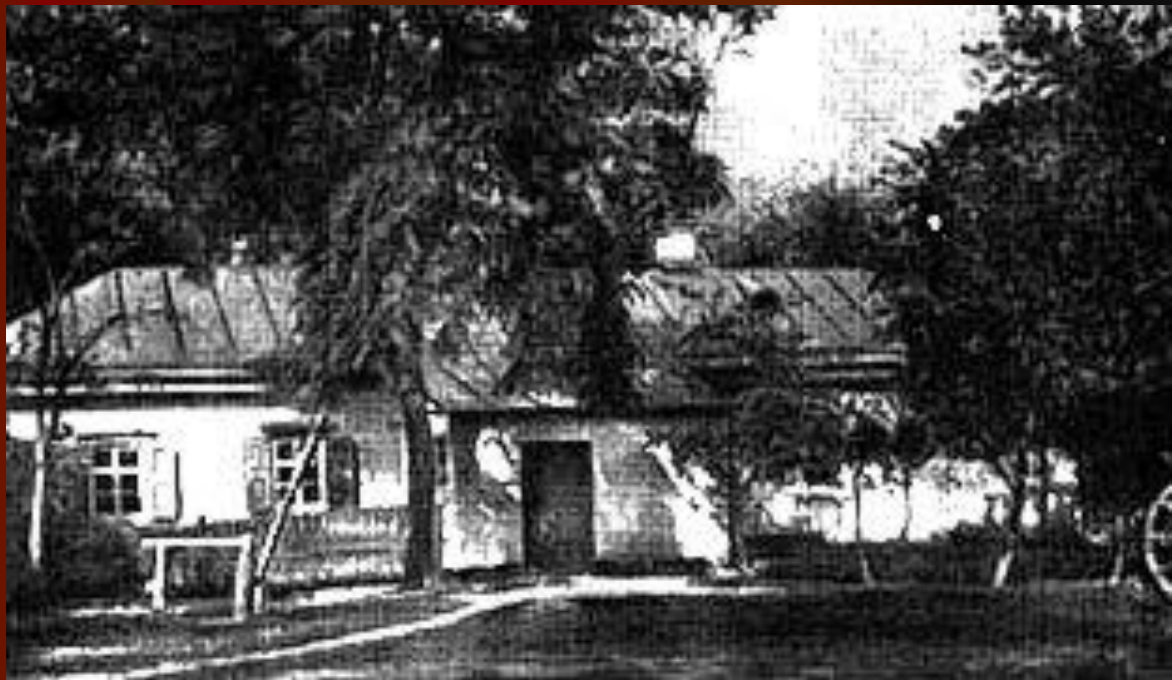
Дом доктора М.Я.Трохимовского в Сорочинцах, где родился Гоголь