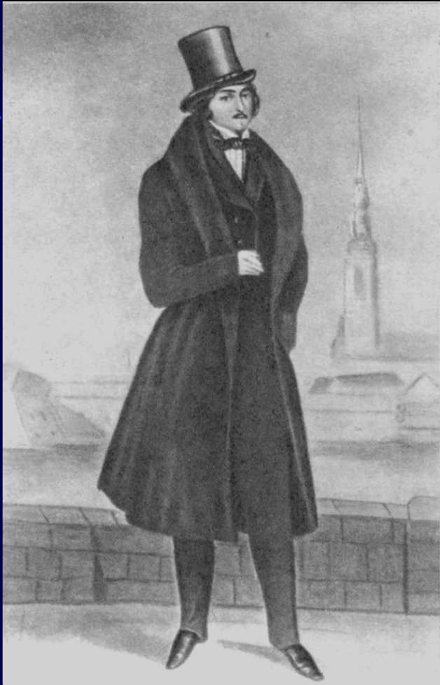
Гоголь Николай Васильевич (1809-1854)