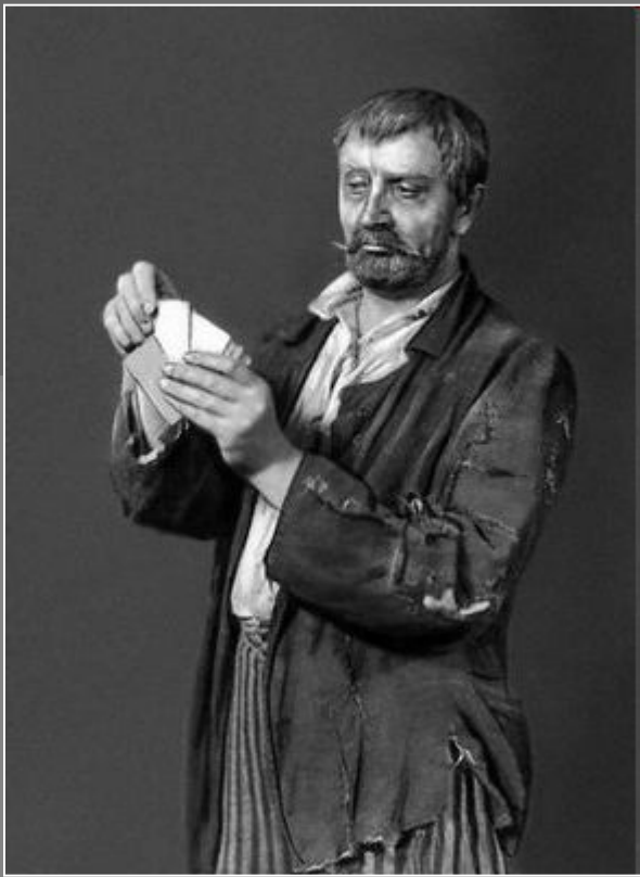
В. И. Качалов в роли Барона ("На дне" М. Горького)